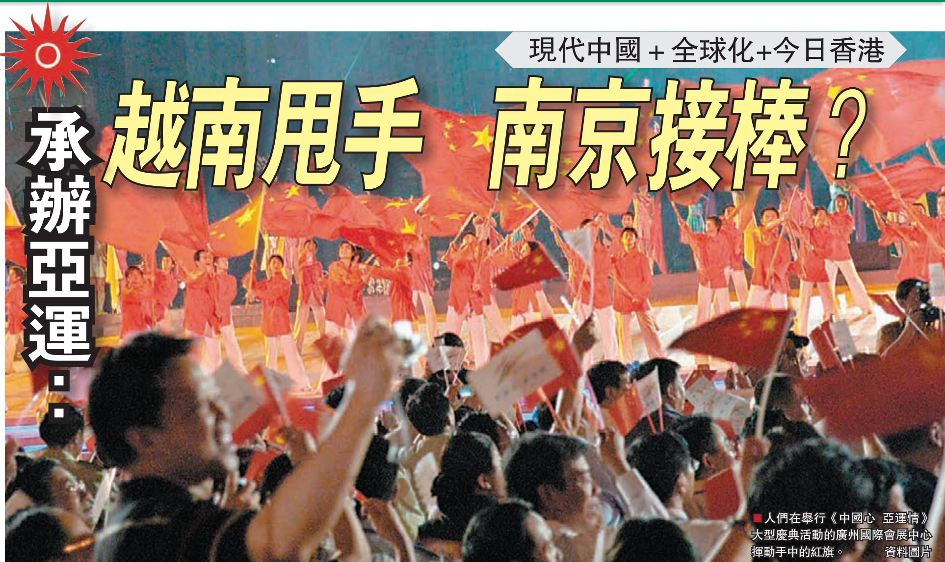
人們在舉行《中國心 亞運情》大型慶典活動的廣州國際會展中心揮動手中的紅旗。