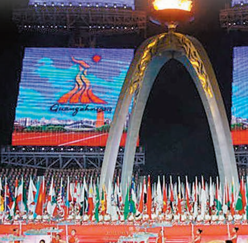
2010年，廣州亞運會開幕式聖火燃起。 資料圖片