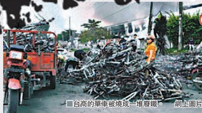
■台商的單車被燒成一堆廢鐵。