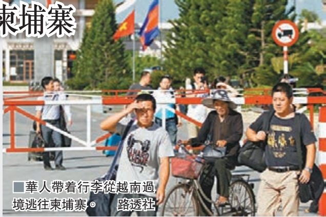
■華人帶著行李從越南過境逃往柬埔寨。

香港文匯報訊 綜合報道，在越南的華人開始越過邊界進入柬埔寨，以躲避越南因南海問題爆發的反華暴行。越南駐金邊大使館發言人說，很多中國人本週開始越過邊界。他說：「這些中國人不是被驅逐出境的，這是他們的個人決定。我不知道為什麼中國人不願意繼續住在那裡的理由。」他說，他不知道他們希望移居柬埔寨還是其他地方。還不清楚有多少華人從越南進入柬埔寨。柬埔寨官員拒絕評論此事。