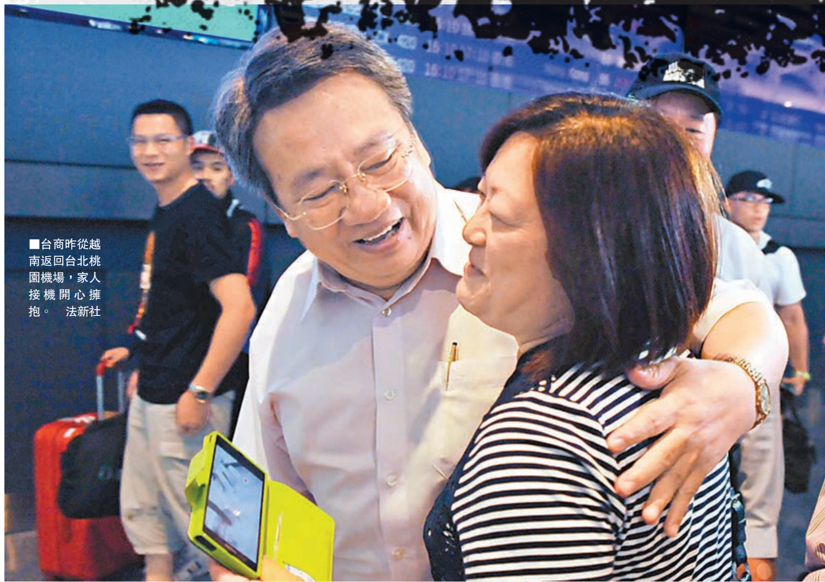
■台商昨從越南返回台北桃園機場，家人接機開心擁抱。