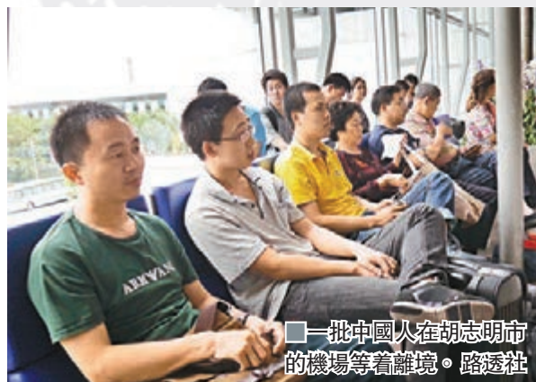
■一批中國人在胡志明市的機場等著離境。