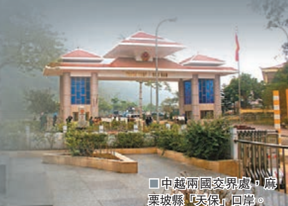
□中越兩國交界處，麻栗坡縣「天保」口岸。

易，不能使用票據和信用證，使得生意受到影響。原來錢差一點，對方都能發貨，現在要百分百現金到賬，對方才發貨過來。雖然越南的生意夥伴一再催促其前去進貨，但因擔心越南南部爆發的反華打砸事件蔓延，她已暫停在越南的生意。