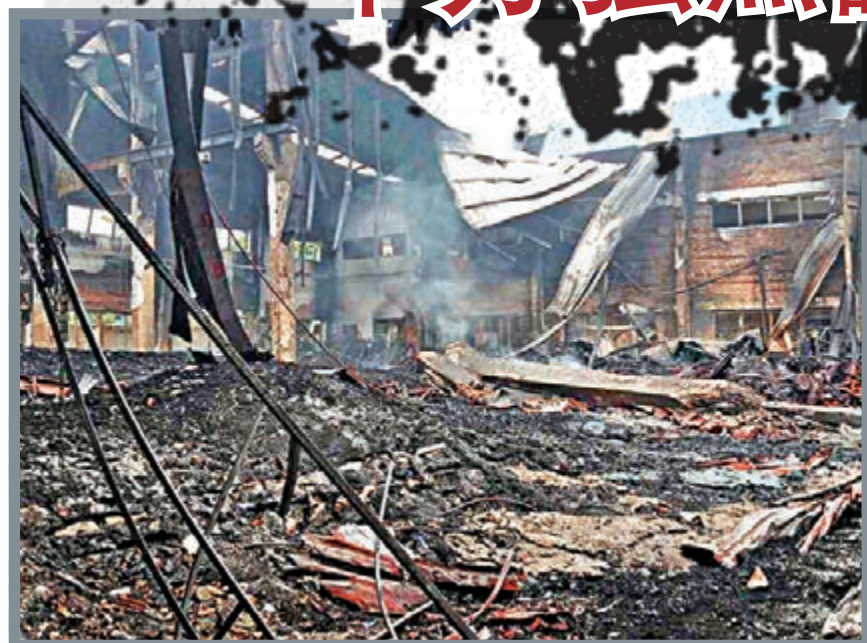
越南平陽省一家台商工廠遭到暴民縱火，廠區內只剩一片灰燼。

香港文匯報訊 綜合消息：越南反華暴亂由南部平陽省蔓延至中部河靜省。台塑在河靜興建中的鋼鐵廠14日發生衝突事件，台塑稱，一名大陸員工死亡，90人受傷。而路透社則稱，事件導致16名華人和5名越南人死亡，100多人送醫。此外，越南平陽省一家台商工廠在火勢熄滅後，發現一具大陸員工屍體。新華社報道稱，越南反華暴亂中，至少兩名中國籍人士遇難，超過100名中國人受傷入院。對此，外交部長王毅昨晚同越南副總理兼外長范平明緊急通電話，向越方表示強烈譴責，提出嚴正抗議。外交部發言人華春瑩表示，近日在越南針對華企的打、搶、燒等行為，與越南近來對國內一些反華勢力和不法分子的姑息和縱容有直接關係。