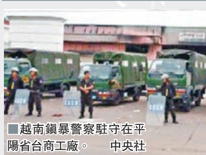
越南鎮暴警察駐守在平陽省台商工廠。 中央社

長助理劉建超率領的跨部門工作組趕赴越南開展工作。此外，中國外交部發言人華春瑩昨日表示，近日在越南針對華企的打、搶、燒等行為，與越南近來對國內一些反華勢力和不法分子的姑息和縱容有直接關係，中方敦促越方嚴肅徹底查處及嚴懲肇事人，賠償損失。