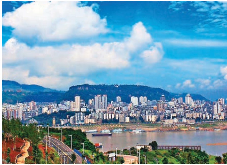
重慶市萬州區一景。

香港文匯報訊(記者 孟冰 重慶報導)重慶萬州區是位於三峽庫區的第二大轄區，移民數量佔三峽庫區的1/5，肩負着「生態涵養」與「重點開發」的雙重使命。萬州提出立足生態涵養發展要求，圍繞五大特色產業，重點發展汽車製造、紡織服裝、裝備製造、照明電氣及農副產品加工產業。