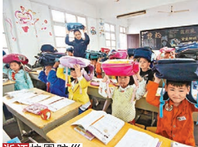
浙江校園防災 派出所民警於5月12日在三友民工子弟小學給學生講解地震避險自我保護知識。當日為「防災減災日」，內地各中小學開展應急疏散、防災減災知識教育活動，提高師生防災減災意識和應急避險、逃生自救的能力。

寧夏 香港文匯報訊(記者 王尚勇、蘇瑞 銀川報導)近日國家民政部將投入資金，支持寧夏CDM環保服務中心依托自身科研成果，面向社區弱勢群體開展社會救助活動。該活動將面向社區居民及其中的弱勢人群，開展老人及慢性病人護理、健康知識和技能、再就業技能等培訓活動，向社區居民提供社區衛生綜合服務，實行健康檔案管理。對於社區孤寡老人、殘疾人員的救助，該項目將免費發放「一鍵通」呼叫設備、LED燈、安裝家居智能管理系統及壁掛式太陽能熱水器。