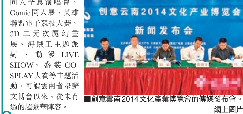
創意雲南2014文化產業博覽會的傳媒發布會。網上圖片

香港文匯報訊(記者 霍蓉 昆明報導)「創意雲南2014文化產業博覽會」將於8月9日至14日在雲南舉辦。其中，以雲南作為今年國家原創動漫邊疆推廣計劃的省份，動漫館是最大亮點，有20個主題活動。屆時，活躍在大陸動漫迷耳熟能詳的知名COSER小小白、地獄蝴蝶丸、菲尼、幸、兔兔、夕顏、祭靈、南野秀君等都將與重量級畫家、畫手、歌手、舞者首次跨界出現，並有600攝影騎士出席角色遊園會，以及來自海內外的動漫企業展示，及COSPLAY道具現場製作表演、初音未來同人全息演唱會、Comic同人展、英雄聯盟電子競技大賽、3D二次元魔幻畫展、海賊王主題派對、動漫LIVE SHOW、盛裝COSPLAY大賽等主題活動，可謂雲南省舉辦文博會以來，從未有過的超豪華陣容。