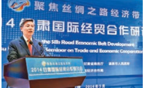
甘肅省副省長李榮燦表示，將開闢蘭州直飛中西亞、中東等地區重要城市的國際航線。

香港文匯報訊(記者 崔國清 蘭州報導)甘肅省副省長李榮燦日前在敦煌舉行的「聚焦絲綢之路經濟帶——2014甘肅國際經貿合作研討會」上表示，甘肅今年將加快建設完善鐵路、公路、航空運輸網絡，積極推動開通從蘭州到中國和中歐一些國家的蘭歐貨運列車，開闢蘭州直飛中西亞、中東和歐洲等地區重要城市的國際航線，將蘭州打造成面向中西亞、中東歐的交通樞紐。