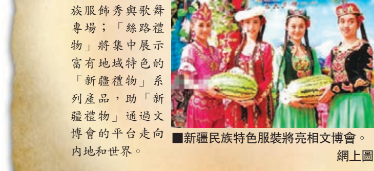
新疆民族特色服裝將亮相文博會。

組委會精心設計了系列活動，如「絲路盛宴」展示新疆美食，觀眾可以現場品嚐新疆的特色美食和乾果；「絲路禮贈」為新疆民族服飾秀與歌舞專場；「絲路禮贈」將集中展示富有地域特色的「新疆禮物」系列產品，助「新疆禮物」通過文博會的平台走向內地和世界。