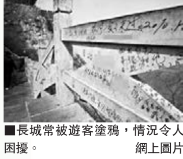
■長城常被遊客塗鴉，情況令人困擾。

中國式「到此一遊」的景區塗鴉刻字陋習屢禁不止。日前，天津黃崖關長城景區新建了塗鴉專區，供遊客刻字留名，防止文物被「毀容」。黃崖關長城位於天津薊縣北30公里的崇山峻嶺之中，是世界文化遺產，國家首批4A級景區。它始建於公元556年，全長42公里，有樓台66座，是中國古長城的一部分。