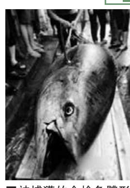
■被捕獲的金槍魚體形有如巨人一般。

有網友稱，去年1月一條重222公斤的金槍魚在日本築地市場以1.55億日圓(約合1180萬港元)售出，若這條確實在重340公斤的藍鰭金槍魚，那漁民豈不是賺大啦？不少網友替漁民開心，「這裡是魚，分明就是一堆人民幣啊！」