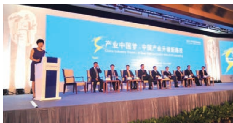
■產業中國高端會議。

這對廊坊來講，是一個最大、最現實、最不能錯失的歷史性機遇。現在的廊坊已成為北京未來發展的新空間，首都生態環境的涵養區，和京津產業轉移的重要承接地。廊坊作為集高新技術產業、現代化製造業基地於一身的園林式、生態型宜居名城，已躍居國內先進城市之列，廊坊的知名度、美譽度、吸引力、承載力與日俱增，成為了京津走廊上一顆璀璨的「綠寶石」。在「八十年代看深圳，九十年代看浦東」之後，京津冀城市群中的廊坊市，將是二十一世紀投資中國的新亮點。位於「環渤海」、「環京津」的金三角上的河北省廊坊市，依托與京津接壤的區位優勢、地緣優勢和產業對接優勢，現正在加快打造河北環京津新增長極戰略突破口。