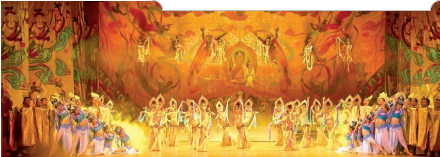
■ 取材於莫高窟壁畫的舞劇《大夢敦煌》已在全世界巡演千餘場，票房收入逾億元。

根據最新規劃，甘肅省發展文化產業五年內預計投資額在6000億元以上，至2020年，文化產業增加值佔GDP的比重達到5%以上。