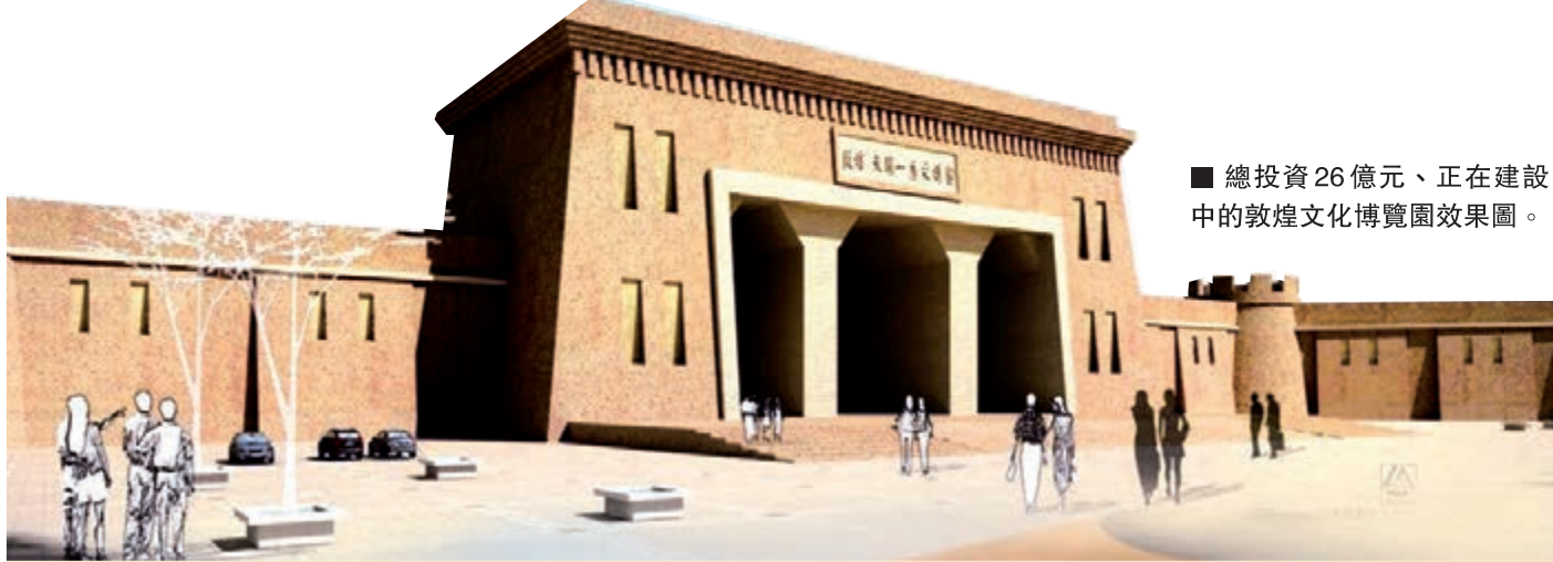
■ 總投資26億元、正在建設中的敦煌文化博覽園效果圖。

據了解，該《綱要》作為《華夏文明傳承創新區總體方案》的開局篇，秉承科學性、國際性原則，經一年多精雕細琢，九易其稿，向世界勾勒出一幅美麗的敦煌藍圖。