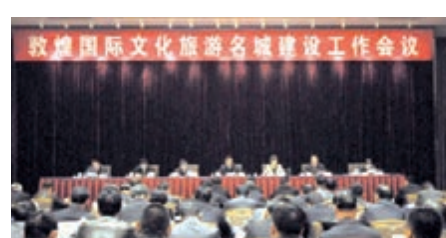
■ 甘肅將敦煌國際文化旅遊名城建設列為「一號工程」。香港文匯報記者 肖剛 攝片，形成一個完整的敦煌印象。

莫高窟遊客中心位於戈壁邊緣，遊客中心內部空間滲透著韻味十足的敦煌元素，聖潔的蓮花、姿態優美的飛天、美輪美奐的壁畫。遊客可以自由地抓取宗教、文化、歷史、生活、形態、意象等信息碎