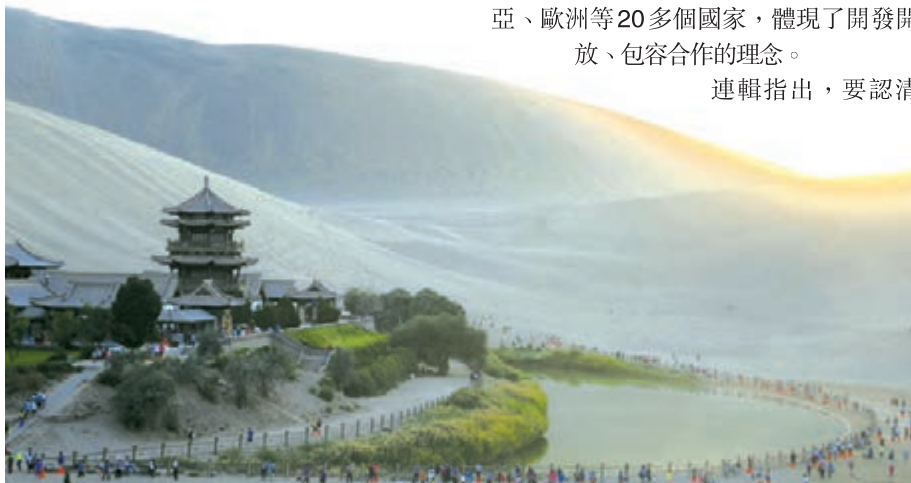
■ 沙漠奇觀月牙泉，沙水共生、沙不掩泉。