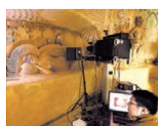
■ 敦煌莫高窟通過數字化實現保護與開發的有機統一。

一年來，甘肅共實施329個重大文化項目，完成投資324.42億元，文化產業實質簽約金額逾1545億元，文化產業增加值達