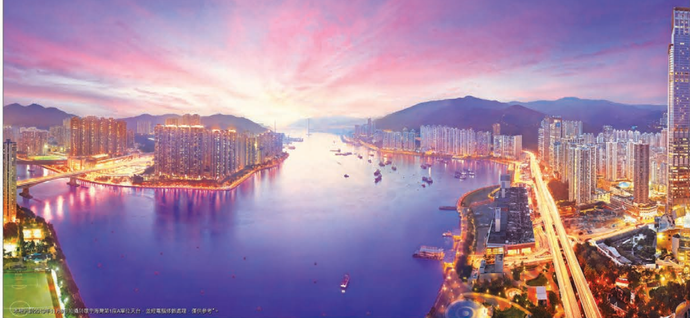
*本圖片於2014年1月8日拍攝於環宇海灣第1座A單位天台，並經電腦修飾處理，僅供參考。*