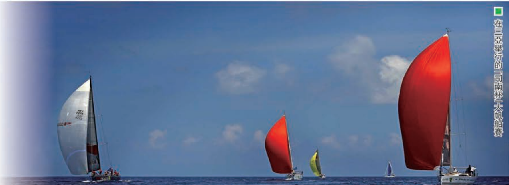
在三亞舉行的「同南杯」帆船賽

截止2013年底，三亞已有各類文化企業1800多家，從業人員2萬多人，文化產業項目39個，已落地文化產業項目30個，計劃總投資高達959.68億元。2013年三亞市有14個項目列入全省重點文化產業項目，佔全省比重的44%。按照相關規劃，到2015年底，三亞的文化產業增加值將達到全市GDP的5%以上，成為又一個支柱性產業。