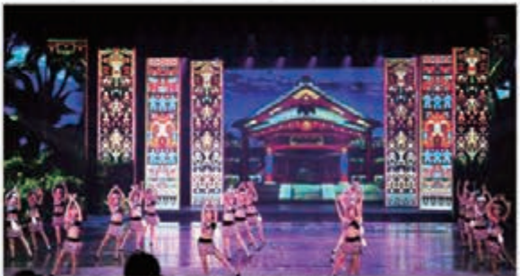
千古情展現三亞歷史文化

去年4月以來在全國30多個城市巡演32場次，觀眾人數達49萬人次；《美艷之冠·晚宴劇場》去年全年演出364場，客流量超過11萬人次；《火鳳凰》音樂劇作為我國文化「走出去」的重點劇目，在美國、加拿大等國進行