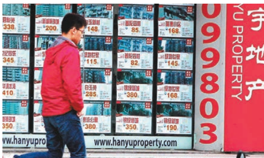
市傳上海排名前五中的兩家大型中介公司將進行10%的裁員。圖為上海地產中介公司。

大,且仍計劃到今年年底前將上海的門店數量從現時的206家增至250家。中原則稱只是通過員工離職實現自然流失。