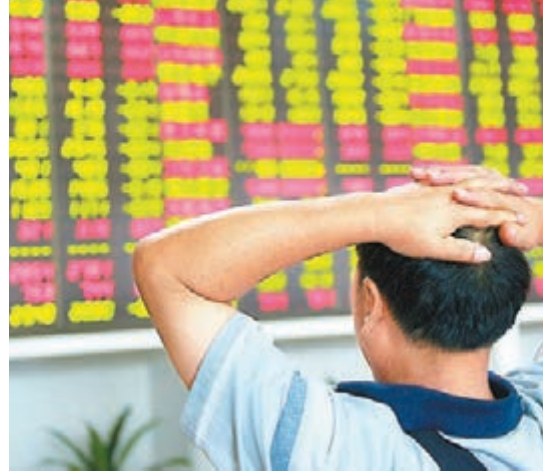
中石油在推進混合所有制改革方面邁出實質性一步。受此消息影響,油改股全線大漲。

香港文匯報訊(記者 裴毅 上海報導)推動周一反彈的新國九條刺激效應昨天未能持續,大市獲利回吐壓力明顯,滬深兩市昨震盪收跌。收盤上證綜指報2,050點,跌2點或0.10%;深成指報7,310點,跌7點或0.11%。創業板指報1,276點,跌0.16%。兩市分別成交737億元(人民幣,下同)和798億元,減少約一成。