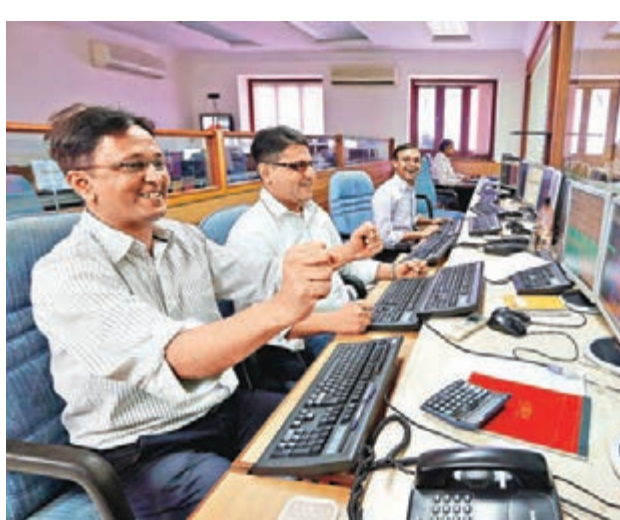
股市創新高，交易員表現興奮。