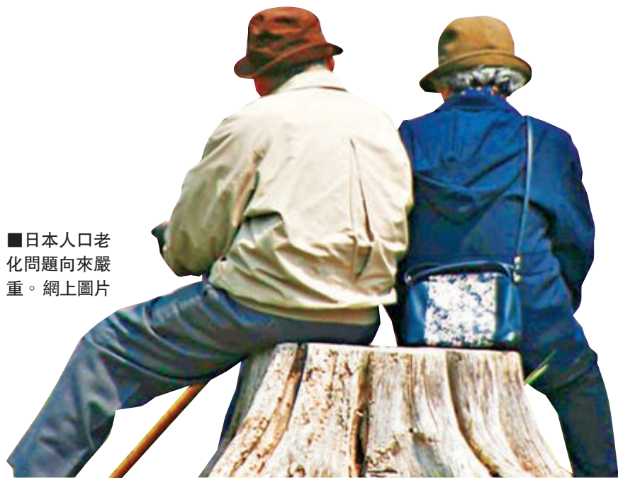
日本人口老化問題向來嚴重。