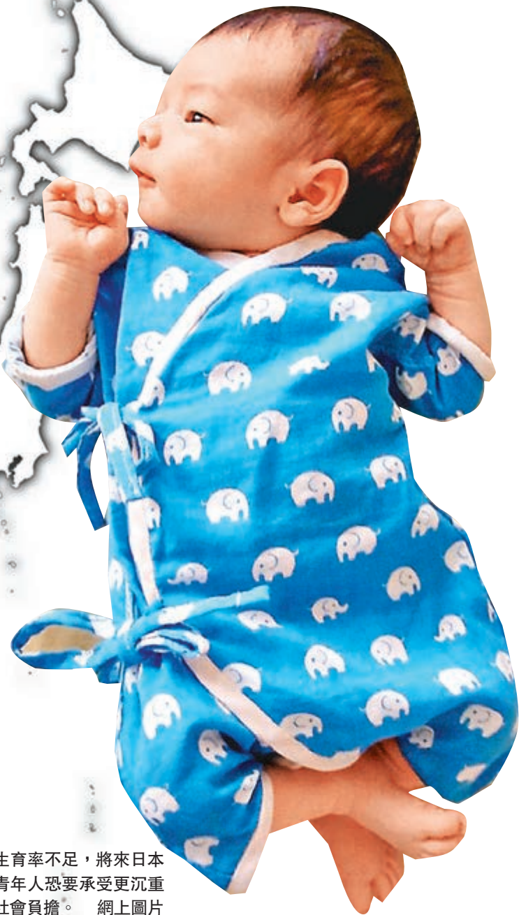
生育率不足，將來日本的青年人恐要承受更沉重的社會負擔。網上圖片