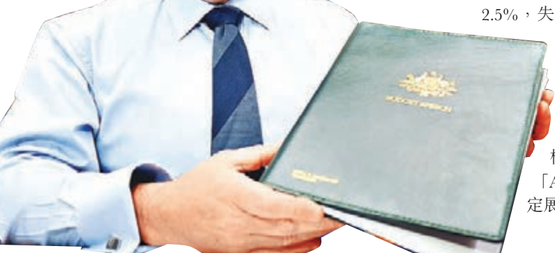
澳洲財長霍基展示新的財政預算案。