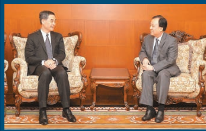
▲梁振英（左）在瑞典斯德哥爾摩，拜會中國駐瑞典特命全權大使陳育明。