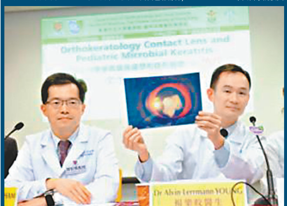
■香港中文大學研究指出，18歲或以下被確診角膜炎個案，近40%與使用「OK鏡」有關。

香港文匯報訊(記者文森)不少人為免被叫四眼妹或四眼仔而選擇配戴隱形眼鏡，亦有家長怕子女近視加深，而選戴可控制近視的「OK鏡」，即角膜塑形隱形眼鏡。但香港中文大學研究指出，18歲或以下被確診角膜炎個案，近40%與使用「OK鏡」有關。中文大學再分析眼科醫院近10年數據，發現23名兒童或青少年配戴「OK鏡」引致嚴重角膜炎個案中，全部康復後眼角膜留有永久疤痕，而且平均只可恢復70%視力，風險不容忽視。