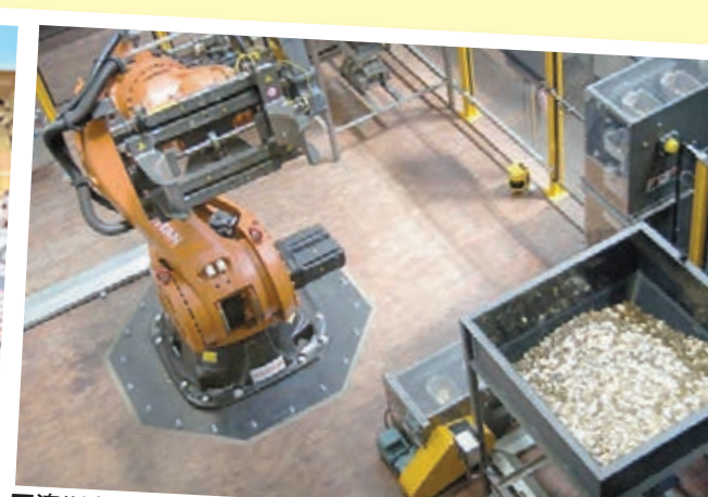
澳洲皇家鑄幣廠可能推行私有化。

金融部長科爾曼昨日受訪時表示，現存近1,000個不同的政府組織是浪費資源、規模過大、太過揮霍，須精簡架構，他歸咎前朝工黨政府導致這局面。今次計劃裁減1.6萬個公僕職位，多過自由國家聯盟去年競選時提出的1.2萬個，削減政府機構的數字也多過原先計劃的40個。