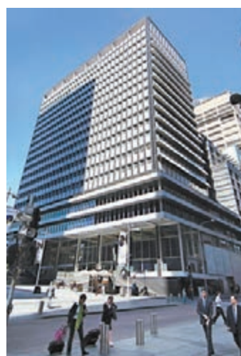
澳洲央行預測到今年年中會增長3%。