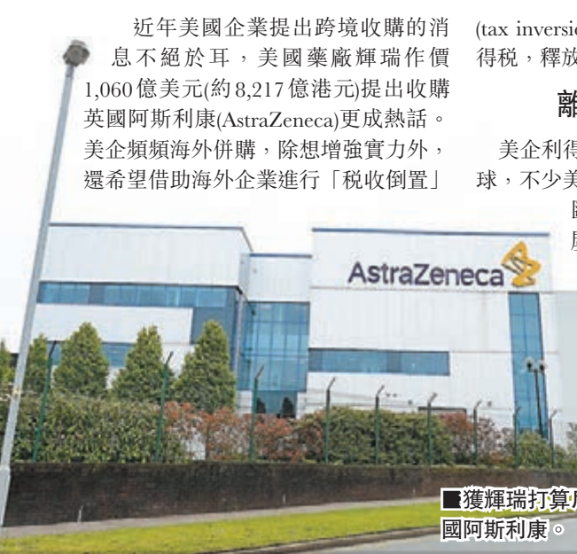
獲輝瑞打算斥巨額收購的英法阿司利康。

近年美國企業提出跨境收購的消息不絕於耳，美國藥廠輝瑞作價1,060億美元(約8,217億港元)提出收購英國阿司利康(AstraZeneca)更成熟話。美企頻頻海外併購，除想增強實力外，還希望借助海外企業進行「稅收倒置」(tax inversion)，繞過美國高昂的企業利得稅，釋放龐大海外資金儲備。