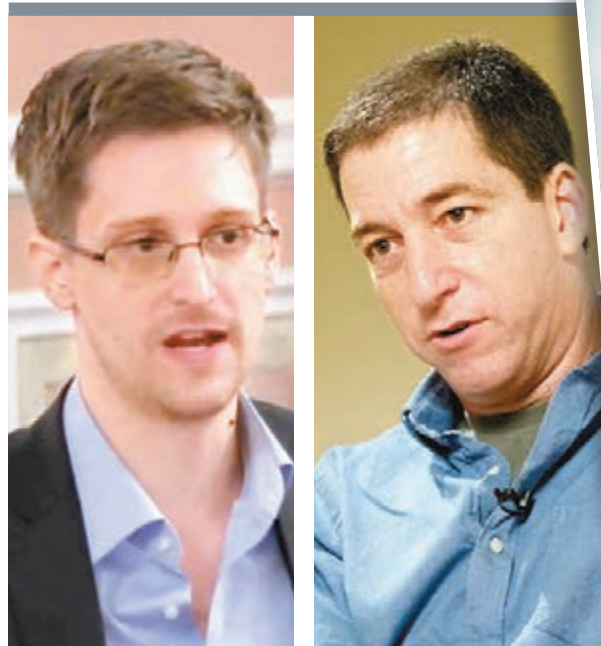
斯諾登(左圖)當時見到格林沃爾德(右圖)時，透露「兩名國安局官員正找他」。