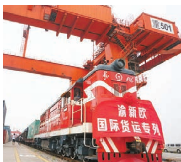
■借力「渝新歐」鐵路聯運大通道，重慶打造內陸開放高地。