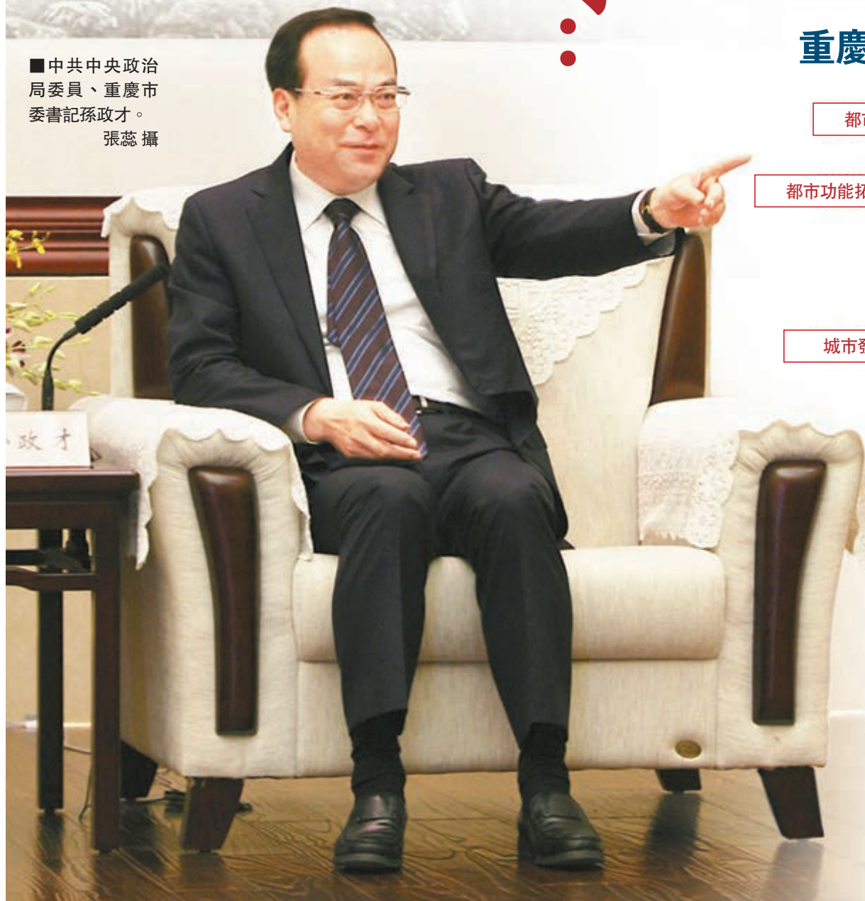
■中共中央政治局委員、重慶市委書記孫政才。

談及重慶現狀，孫政才以「重慶形勢總體很好」做概括，並笑言「我這樣說可能顯得不太謙虛」，逗得參訪團員一片笑聲。他如數家珍地通報了重慶經濟社會發展數據：2013年重慶GDP增長12.3%，公共預算財政收入增長15.5%，工業增加值增長13.6%，進出口總額增長29%；今年一季度，在全國經濟下行壓力加大的情況下，重慶保持了10.9%的經濟增長率，公共財政預算收入、進出口、規上工業增加值等主要經濟指標同比分別增長16.5%、87.4%、13%，增幅在全國名列前茅。一連串精確到小數點的經濟數據，從孫政才口中流暢而出，令參訪團團員近距離感受到了這位中國最年輕政治局委員的睿智風采。