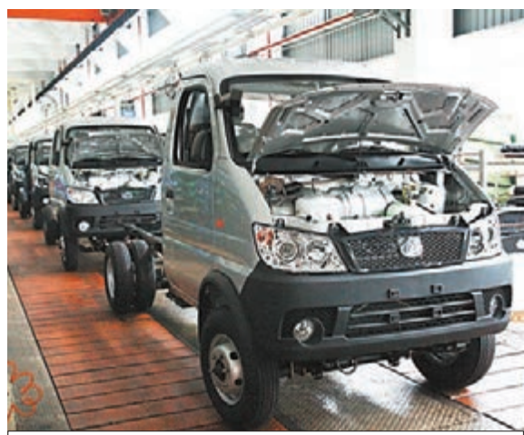
■萬州區長安跨越汽車廠。