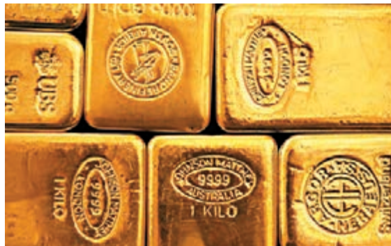
■烏克蘭地緣緊張局勢升溫，對金價帶來支持。

上週四歐洲央行會議後，在央行行長德拉吉講話中，意外提到6月份歐洲央行或許有實質性的動作推出，導致歐元高位回落，同時帶動美指低位反彈回升。由於歐洲央行在下次會議上採取寬鬆行動或已成定局，故從短線看，歐元仍需有下跌空間，而對美元則會借勢反彈，這無疑亦會相應對金銀造成壓力。