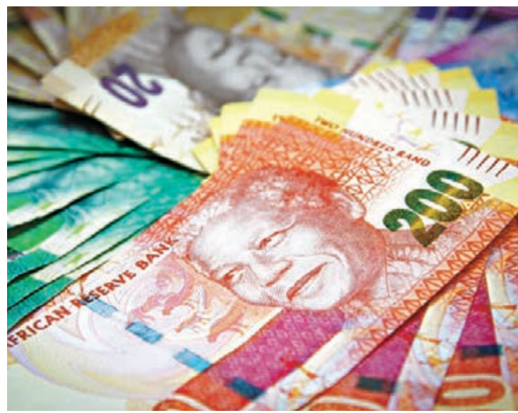
■南非貨幣「蘭特」今年貶值不到1%，促使資金持續回流該國資本市場。

由於南非經濟研究院公佈的3月份採購經理指數(PMI)經過季節性調整為50.3，穩守於榮枯分水嶺邊緣，加上今年「蘭特」貶值幅度較去年的20%，有大幅收斂之餘，而該貨幣近一季都是處於止跌回升態勢。