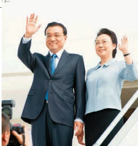
內地網民盛讚李克強及其夫人很有夫妻相。資料圖片