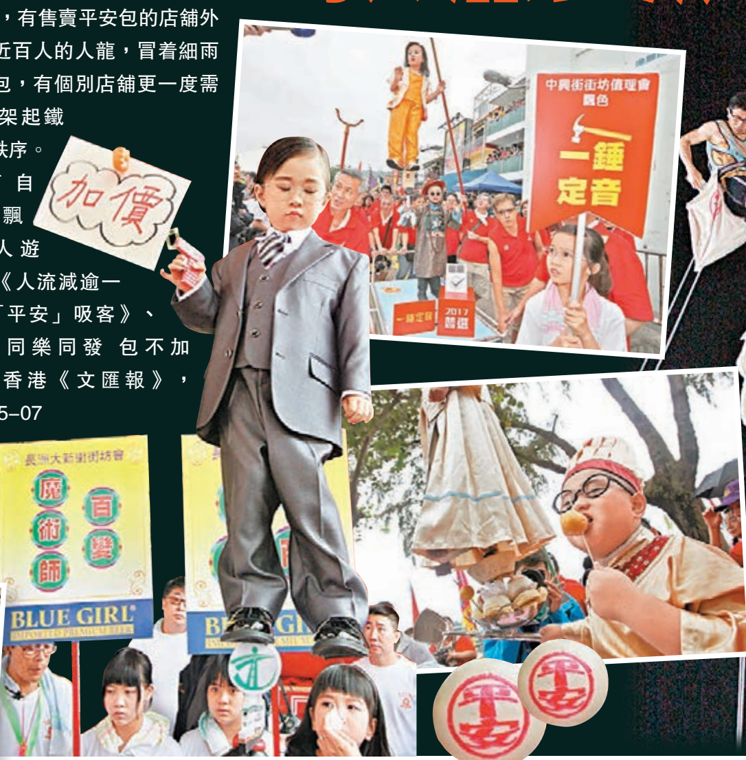
長洲太平清醮的繪包山及飄色巡遊令人目不暇給。