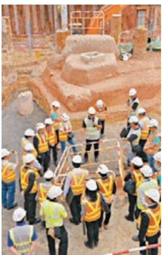
古物諮詢委員會成員視察港鐵沙中線地盤內的古井遺址。