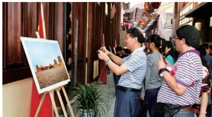
絲綢之路風情街吸引眾多遊客。

館榮獲「中國文化遺產保護與傳承典範單位」,成為中國歷史上第一家民辦國家二級博物館,是中國第一家與絲綢之路沿線近10家博物館簽訂共建友好館的民辦博物館。據悉,目前大唐西市重點打造的五個文化產業鏈已初見成效。絲綢之路風情街,它是中國乃至國際上唯一「一站式」體驗絲綢文化和異域風情的商旅文化勝地;大唐西市國際古玩城,它是中國西北地區規模最大、檔次最高、服務設施最完善的國際古玩交易市場;非物質文化遺產產業,主要是對中國陝西境內107個市縣的非物質文化遺產進行保護、展出;會展中心,每年將舉辦各種大型的會展活動;還有胡姬酒肆演藝中心,重現了唐代西市國際娛樂時尚盛景。