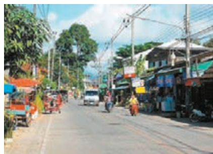
▲泰國邊境小城清孔街景。資料圖片

香港文匯報訊 據《法制晚報》報道,安徽省公安廳近日宣布,一場跨國追捕特大詐騙疑犯案件成功結束。安徽