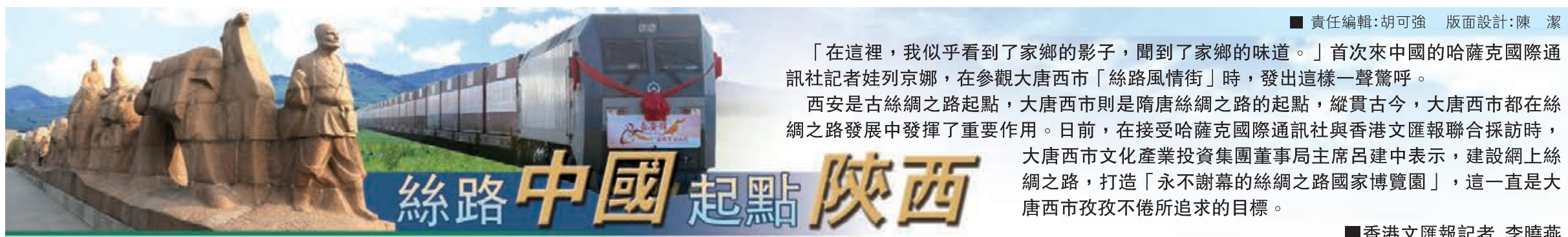
責任編輯:胡可強 版面設計:陳潔

5月7日3時至20時,天津宏迪檢測公司在南京中石化五建公司內進行作業期間,丟失用於探傷的放射源銱192一枚。至5月10日18時許丟失的放射源銱192被安全回收。