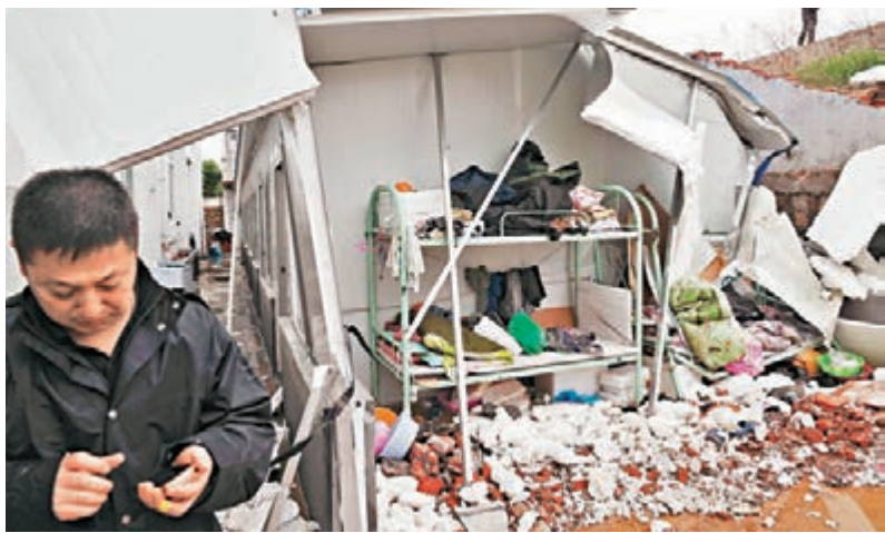
▲圖為事故中被壓倒的職工居住板房。

青島氣象局部門向本報表示,從10日夜間到11日11時,青島市普降大到暴雨,局部大暴雨,全市平均降水量為65.9毫米,平均風力達到6級,陣風8級,其中黃島區平均降雨量達79.7毫米,最大點達131毫米。