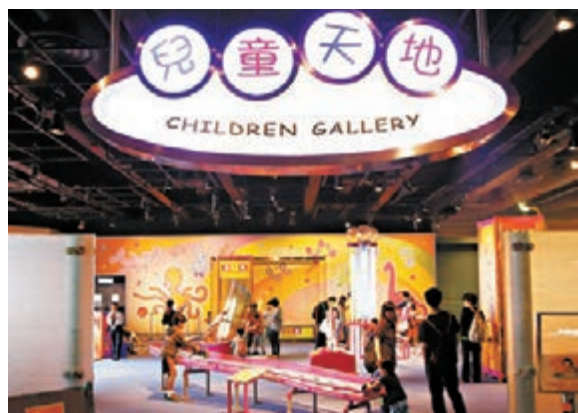
「兒童天地」一直深受歡迎，但現時面積太細，亦將進行翻新工程，料2016年中竣工。