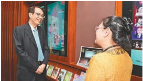
鄧國威(左)參觀油麻地戲院，聽負責人介紹戲院設施。

香港文匯報訊(記者 聶曉輝)公務員事務局局長鄧國威早前到訪油尖旺區，實地了解區內最新發展，並與油尖旺區區議員會面。鄧國威在香港理工大學常務及學務副校長陳正豪教授及油尖旺民政事務專員何小萍陪同下，首先到理大賽馬會創新樓參觀。該大樓為理大設計學院及賽馬會社會創新設計院的總部，由香港賽馬會慈善信託基金捐助興建。鄧國威在視察大樓內的設施時，得悉大樓有助鞏固理大在亞洲設計界的地位，並提升其在創新設計上的聲譽，從而促進本港創意產業的發展。