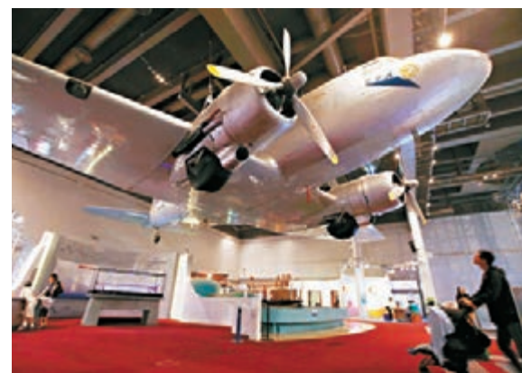
DC-3客機亦是科學館的另一珍藏，它是香港首架客機，也是館內第一件安裝的展品。