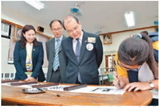
張建宗(左三)觀看保良局林文燦英文小學的菲律賓籍學生表演中文書法。

香港文匯報訊(記者 聶曉輝)勞工及福利局局長張建宗日前前往九龍城，到訪區內小學、社會服務單位及區議會，了解區內為老中青與不同族裔社群提供的服務，以及地區上關心的事宜。