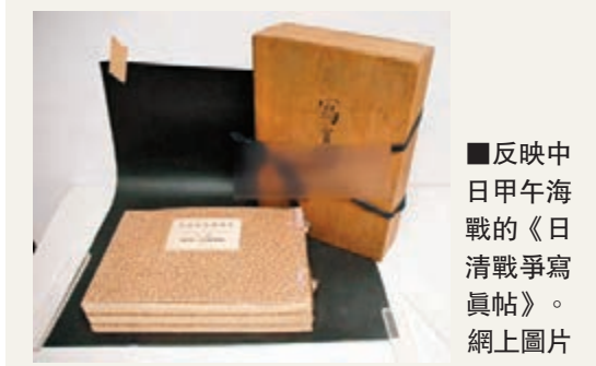
反映中日甲午海戰的《日清戰爭寫真帖》。

香港文匯報訊 即將於明天(13日)在北京舉行的北京華辰春季拍賣會上，一批揭露日本在華侵略活動的珍貴影像收藏品將現身拍賣。據新華社報道，其中，有小川一真的反映中日甲午海戰《日清戰爭寫真帖》、東北遼西抗日義勇軍照片，以及肯卡爾拍攝的上海「八一三」事變寫真相等等，有望為中國歷史、中國影像史和攝影史的研究和構建提供珍貴的實物資料。此次春拍中，華辰影像共推出「影像中的通商口岸」、「影像的佔領——日本對華影像採集」、「攝影版畫」、「攝影家代表作集」等專題，進一步探究、擴展、梳理和完善中國攝影史的收藏脈絡，促進對經典作品的深度研究。其中，「1894—1945中日戰事影像」專題，以時間順序為線索，梳理出一批揭露日本在華侵略活動的珍貴影像收藏品，其中有小川一真的反映中日甲午海戰《日清戰爭寫真帖》等。值得關注的是紅色經典和攝影名家板塊，眾多孤品和名作將悉數登場。其中，紅色經典部分包括沙飛拍攝的晉察冀邊區第一屆參議會原版照片、雷燁拍攝的冀東抗日原版照片，和以手工上色、巨幅製作的攝影家呂相友代表作《揮手中的毛主席》等。