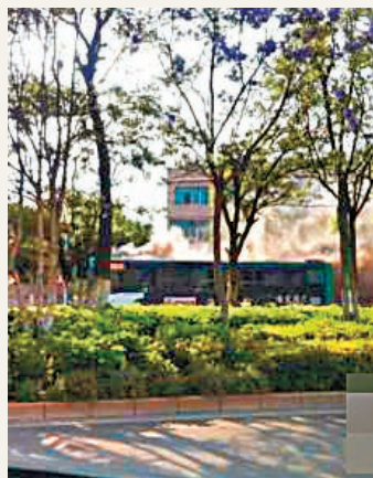
雲南省昆明市發生巴士自燃現場。

香港文匯報訊 據新華社對外部官方微博「中國獨家報道」消息,昨日下午5時20分許,雲南省昆明一輛106路公共汽車(巴士)在市區滇池路發生自燃,約30名乘客被司機及時疏散逃生。據初步了解,整個過程沒有人員傷亡。司機初步判斷,車輛發生自燃的原因可能是蓄電池短路。目前,相關情況正在進一步調查處理中。