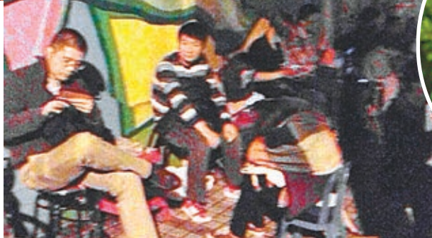
家長通宵排隊輪候幼兒園派報名表。

「我家寶寶今年到了入園年齡,過來排隊是為了拿到報名登記表,名額有限,如果來晚了就沒有了。」去年才入住該小區的涂小姐告訴記者,聽說每年都有很多人排隊,今年她特意提前兩天開始排隊。沒想到,有這樣想法的不