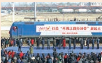
「長安號」國際貨運班列去年11月底正式運行,為中國與中亞的產業互補打通了一條黃金通道。

他並表示,目前中國與哈薩克斯坦開展合作的的城市越來越多,但相信絲綢起點的西安一定會是哈薩克斯坦最便捷、最有利的選擇之一。