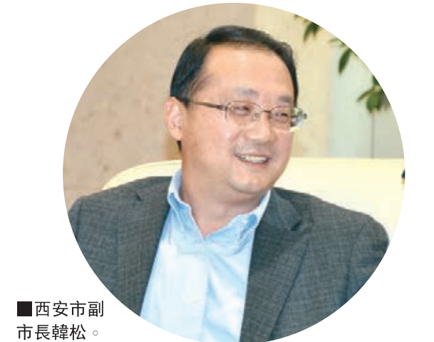
西安市副市長韓松。