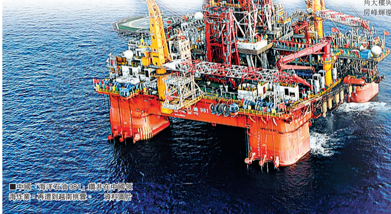
■中國「海洋石油981」鑽井在中國領海作業,再遭到越南挑釁。資料圖片

《紐約時報》指出,儘管中國聲稱中國船隻噴水柱驅趕越南船隻做法顯示其克制,但仍凸顯中國對待亞洲鄰國日益強硬的姿態。《紐