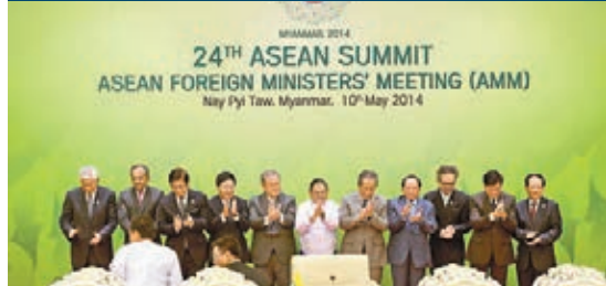
■東盟峰會前,外長發表聲明,對中越船隻在南海有主權爭議的海域相撞,表示嚴重關切。

香港文匯報訊 綜合報道,為期兩天的東盟峰會昨日在緬甸首都內比都開幕,峰會前東盟十國外長發表聲明,對中越船隻在南海有主權爭議的海域相撞,表示嚴重關切。聲明敦促各方保持克制,避免採取危害地區和平與穩定的行動。聲明又呼籲涉及南海主權的國家,通過和平手段解決爭端,而不是訴諸武力。長期在越南外交部任職的東盟秘書長黎良明說,撞船事件顯示,東盟和中國有需要盡快就南海行為守則達成共識。有東盟成員擔心,有關爭端會導致軍事衝突,影響地區穩定,以及可能令東盟在2015年建立經濟共同體的計