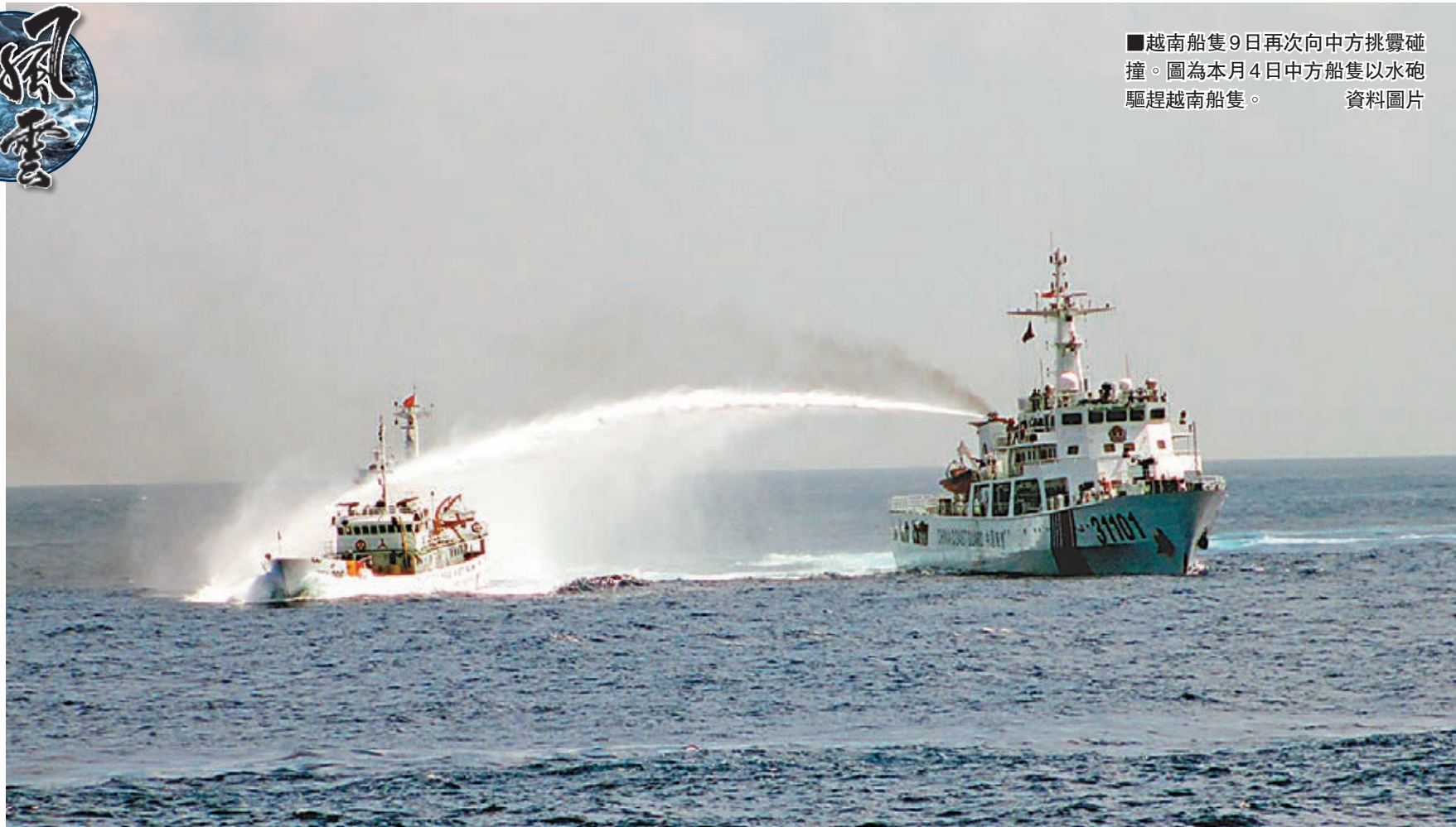
■越南船隻9日再次向中方挑釁碰撞。圖為本月4日中方船隻以水砲驅趕越南船隻。資料圖片

哈克之前一天回答有關問題時表示,聯合國希望並相信「有關國家能夠友好解決相關的爭端」。他沒有評論任何細節。