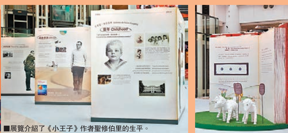
展覽介紹了《小王子》作者聖修伯里的生平。