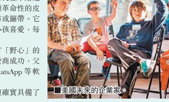
美國未來的企業家。

但願內地的企業家培養年齡，不會降低到五歲。成人社會的爾虞我詐，豈是五歲孩童所能承受和學習的。