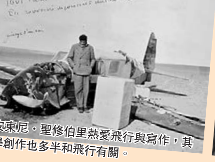
除了《小王子》外，聖修伯里撰寫了多部飛行相關的小說。