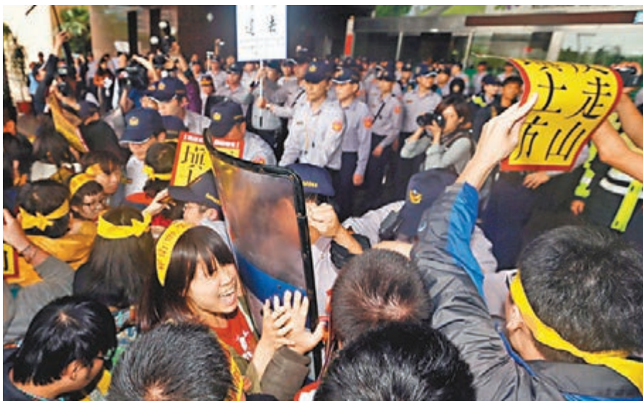
青年樂生聯盟等團體9日在台北市政府訴求「反走山、填土方、反逼遷」，遭警方舉牌警告。

郝龍斌表示，如果是合法集會，只要和平理性，會尊重表達意見的權利。可是跨越了這個範圍，台北市府就會採取必要手段，排除這些問題，讓市民生活交通不受