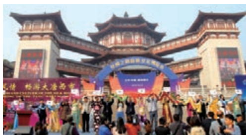
去年10月在西安大唐西市舉行的絲綢之路商旅文化博覽會。

據悉，早在去年10月，陝西省商務廳就已經開始行動，聯合相關單位在西安大唐西市舉辦了「絲綢之路商旅文化博覽會」及「絲綢之路沿線國家經貿合作暨陝西向西開放對接會」。哈薩克斯坦、吉爾吉斯斯坦、伊朗、土耳其等28個國家和地區的外交使館、政府機構、商協會、經貿機構、企業界人士代表共70多位參加，使這一博覽會成為陝西與包括哈薩克斯坦在內的絲綢之路沿線國家在經貿、文化、旅遊等領域合作的一個長期交流互動平台。