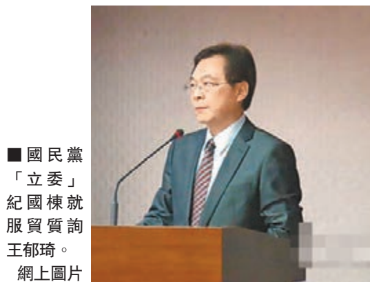
國民黨「立委」紀國棟就服貿質詢王郁琦。網上圖片

香港文匯報訊 據《旺報》報道，陸委會主委王郁琦5月8日表示，如果服貿遭到修改，可能造成協議無法生效，風險太高，將思考更動條文以外的辦法，例如附帶決議或啟動緊急磋商。 陸委會主委王郁琦日前表示，「若服貿遭修改，只好試着跟大陸談」，遭外界質疑政府立場鬆動。8日，他在「立法院」澄清，如果更動服貿條文，可能造成協議無法生效，風險太高；陸委會將思考更動條文以外的方案，例如附帶決議，或等協議生效後，啟動緊急磋商機制。