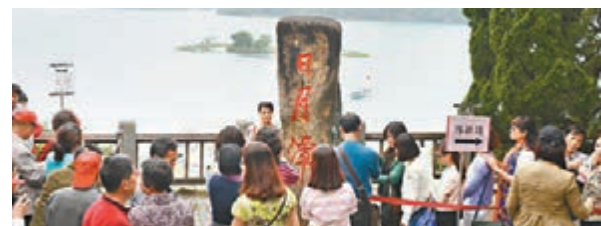
明年陸客團每日來台上限，將限在5,000人內。新華社

香港文匯報訊 據台灣《經濟日報》報道，「交通部」長葉匡時8日表示，今年首季陸客自由行程量成長，一旦確認自由行程觀光效益可「雨露均霑」，讓全台多數商家受惠，不排除上調每日來台人數上限至5,000人。不過，為了調節陸客來台品質，明年起，不分淡旺季，陸客團每日來台上限，都將壓縮在5,000人內。 首季觀光表現氣勢如虹，在陸客、韓、日、星港澳等自由行程觀光客助力下，不僅來台旅客大增，也一舉帶動島內旅館、餐飲業營業額與空運量，較去年同期增長超過5%。