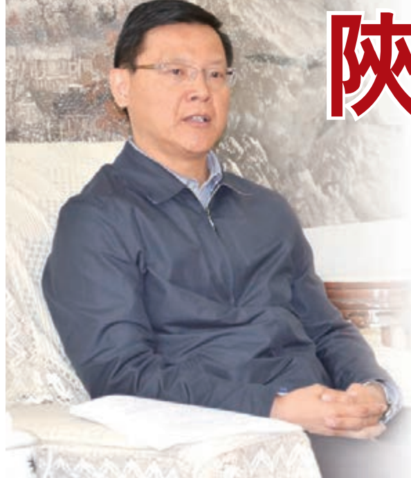
陝西省商務廳廳長姚超英。

日前，即將率團赴哈薩克斯坦進行經貿合作活動的陝西省商務廳廳長姚超英，在接受哈薩克國際通訊社與香港文匯報聯合採訪時表示，陝西和哈薩克斯坦有着很好的合作基礎，經濟互補性強，發展空間大。此次赴哈參加中國出口商品展，希望通過多層次的直接交流，讓越來越多的哈薩克斯坦民眾瞭解陝西商品。同時，也希望通過雙方的合作，讓更多的哈薩克斯坦優質產品能輸入陝西。