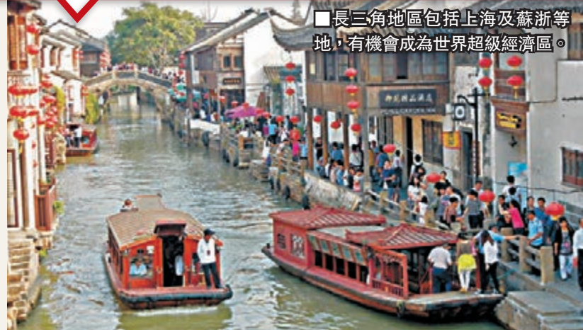
長三角地區包括上海及蘇浙等地，有機會成為世界超級經濟區。