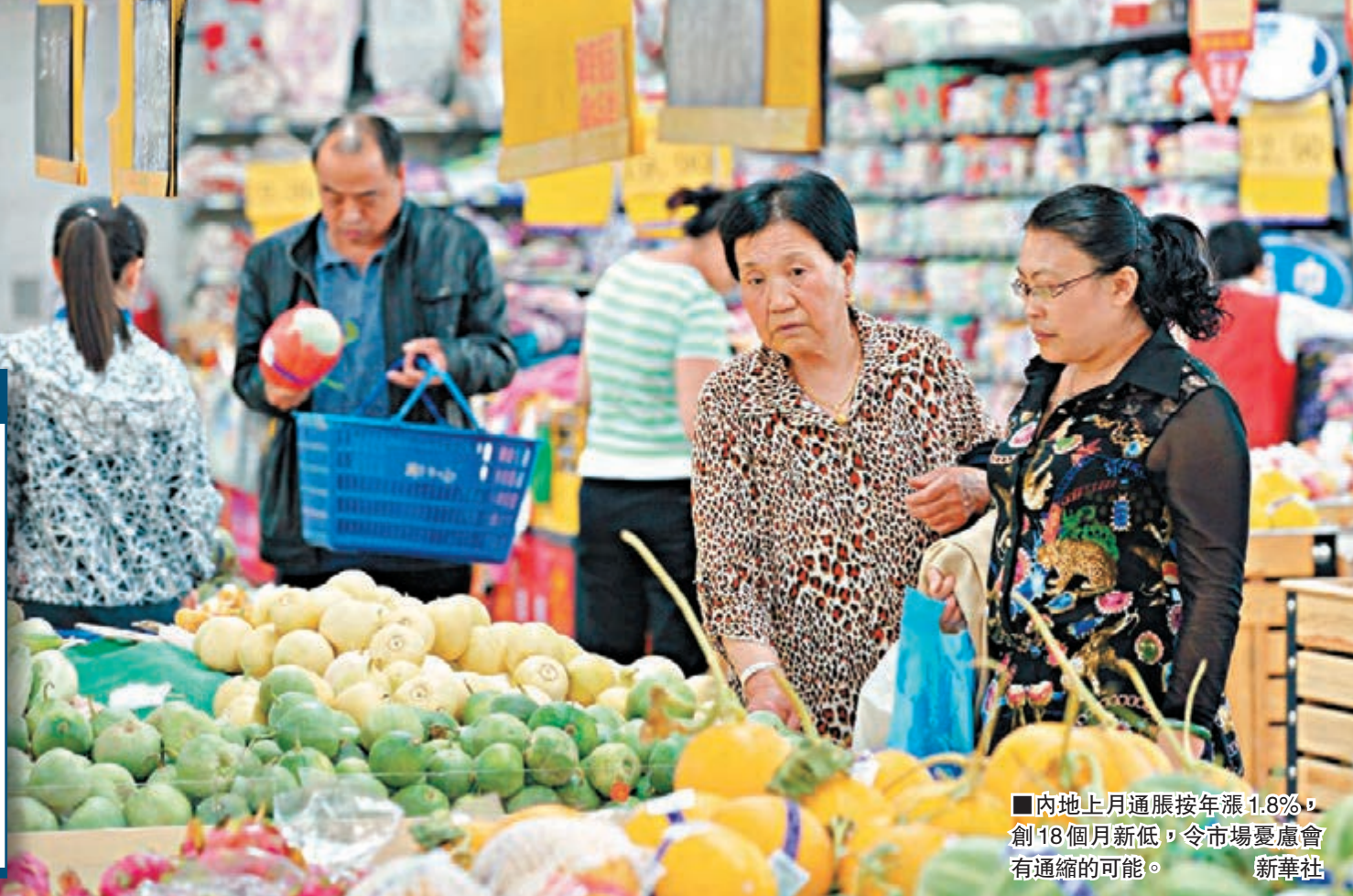
內地上月通脹按年漲1.8%，創18個月新低，令市場憂慮會有通縮的可能。

數據顯示，4月CPI同比上漲1.8%，漲幅較上月回落0.6個百分點。其中，城市上漲1.9%，農村上漲1.6%；食品價格上漲2.3%，非食品價格上漲1.6%；消費品價格上漲1.4%，服務價格上漲2.7%。1-4月平均CPI比去年同期上漲2.2%。從環比看，4月CPI下降0.3%。