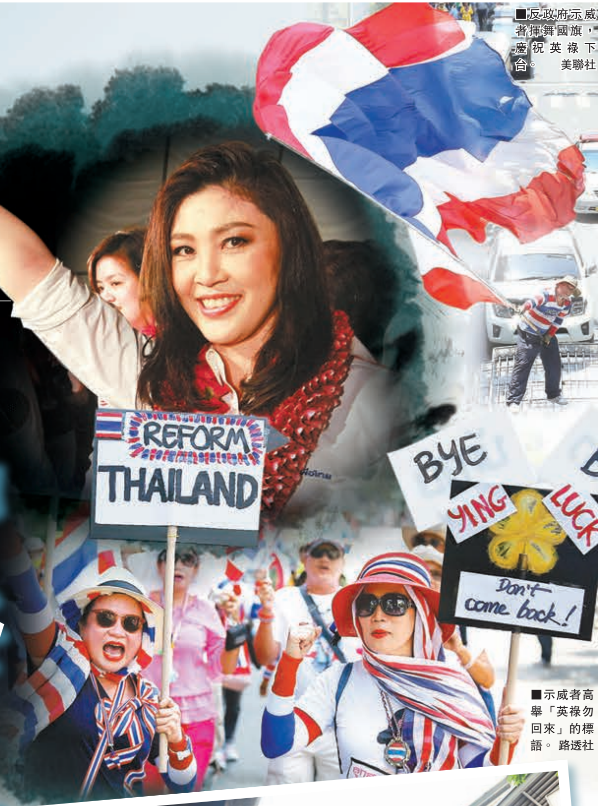
■反政府示威者揮舞國旗，慶祝英祿下台。