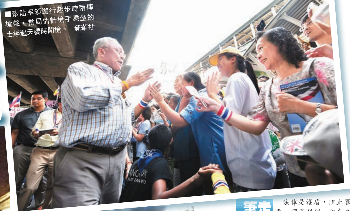
■素貼率領遊行起步時兩傳槍聲，當局估計槍手乘坐的士經過天橋時開槍。