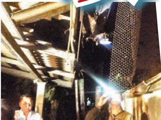
■一名參與英祿案審訊法官的寓所遭投擲手榴彈，車房頂損毀。網上圖片