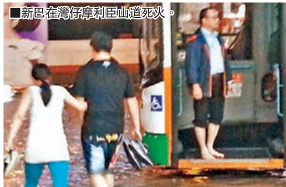
新巴在灣仔摩利臣山道死火。

橫琴法院方面表示,法院自今年3月21日開始正式履職收案,運行1個多月,目前整個審判流程的各個環節銜接比較順暢,開局良好。截至5月8日,共受理民事案件30多宗,其中涉澳案件3宗。