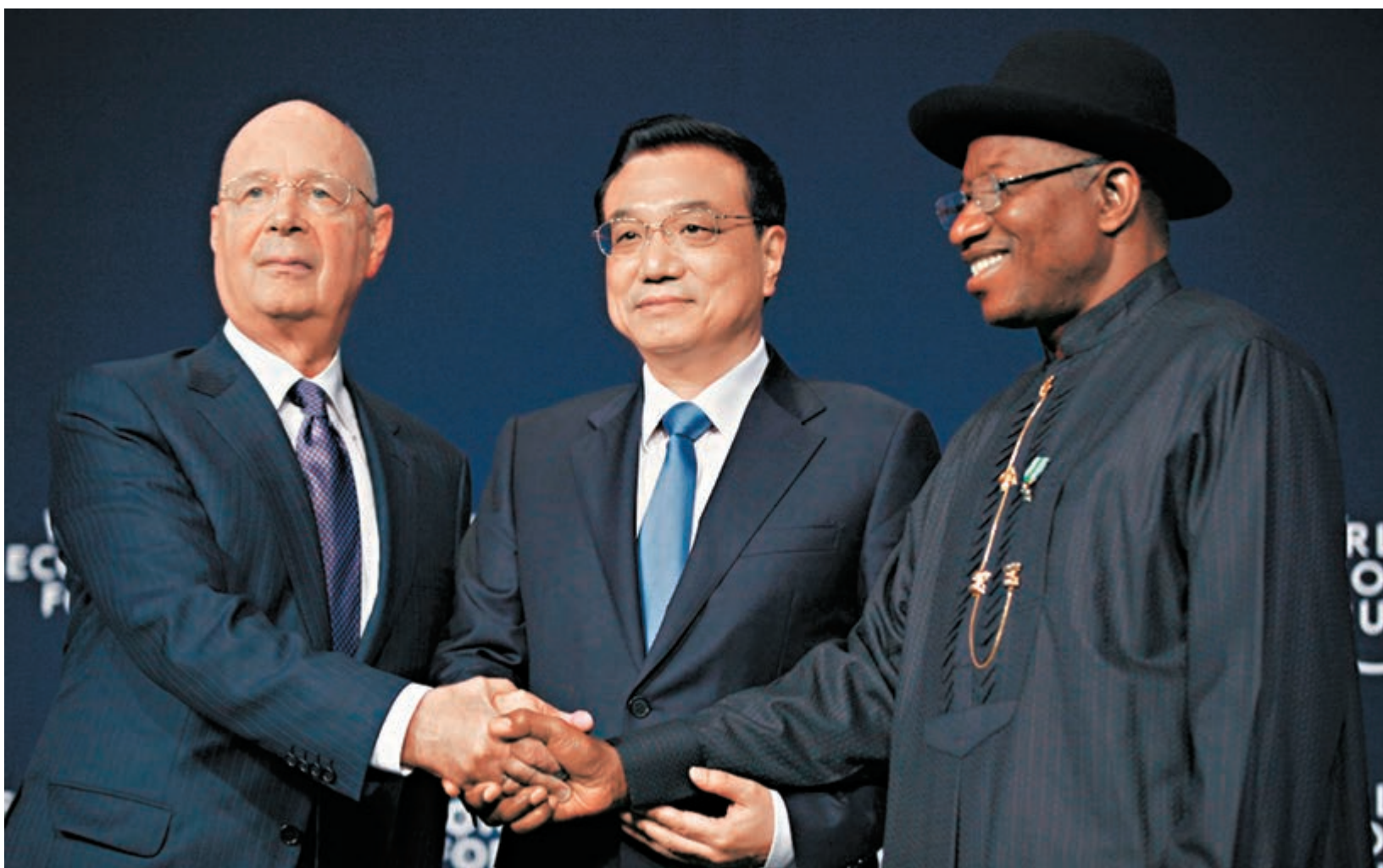
李克強昨日出席世界經濟論壇非洲會議,與世界經濟論壇執行主席Klaus Schwab及尼日利亞總統喬納森握手。

關於李克強的「高鐵外交」,前中國政府非洲事務特別代表劉貴今表示,領導人出訪期間,推銷本國的經濟長項,帶本國經貿團去促進經貿合作,這是國際上一種傳統的做法,而李克強總理在這方面做得可圈可點。中國高鐵技術可靠成本較低,適合於廣大發展中國家,向非洲輸出高鐵技術和管理經驗,有助於非洲基礎建設和長遠的發展。