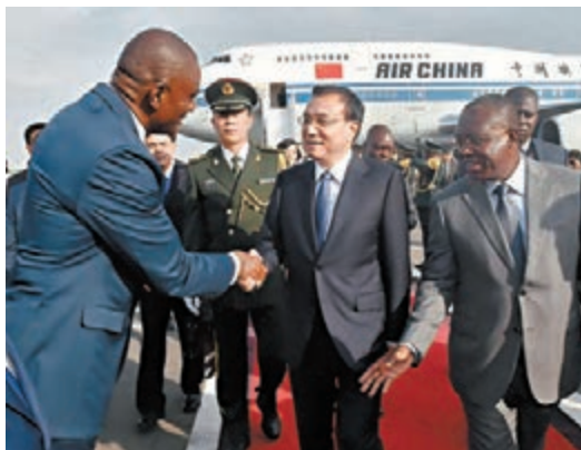
安哥拉副總統維森特(右一)到機場迎接李克強總理。