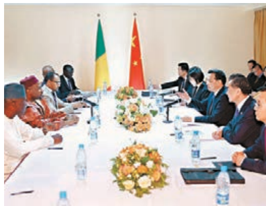
李克強與馬利總理馬拉及相關官員會面。