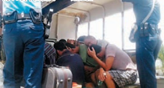
■被菲律賓海警攔截並扣查的11名中國漁民。

香港文匯報訊 菲律賓官方昨日上午稱，本周二在南沙群島半月礁附近海域被該國海警攔截並扣查的11名中國漁民已被送到菲南部巴拉望省省會普林塞薩港市，接受身份「核查」。菲律賓警方指他們將面臨違反當地野生動物保護法律的指控。在海南，成功逃脫菲武