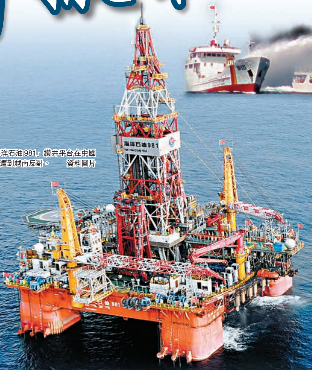
■中國「海洋石油981」鑽井平台在中國領海作業，遭到越南反對。 資料圖片