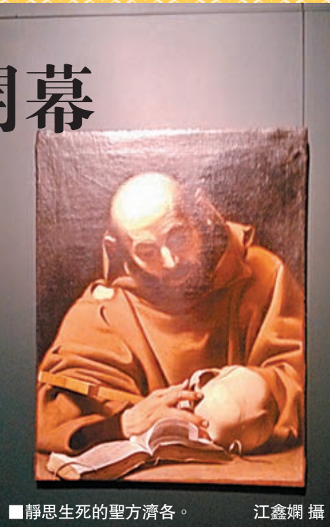
靜思生死的聖方濟各

洛克雕塑作品。十七世紀，與之前最受歡迎和普及面最廣的繪畫藝術相比，雕塑在羅馬藝術中佔據了上風，並取得了卓越的藝術成就。