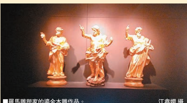
羅馬雕塑家的鍍金木雕作品

當然，郭浩滿認為這其中亦不乏具有獨特想法且具有專業水平的藝術家。然而，當他們的作品往往在人為力量推動下把其價格提高至遠超過應有的地位，同樣會產生誤導成分並不可避免地要大幅調整，最終亦會對市場產生傷害。