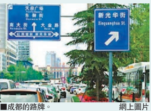
■成都的路牌。 網上圖片

市政管理 香港文匯報訊(記者 劉銳 四川報導)《成都市地名管理條例》近日獲通過，明確禁止有償命名地名，禁止以國外地名、國內外企業名、產品名和商品名為道路、橋樑、隧道、軌道站點等城市公共設施命名。管理範圍涵蓋山、河、湖、濕地等自然地理實體名稱，行政區域名稱和村、社區、區片等名稱，公路、城市道路、橋樑、隧道、軌道站點等名稱，城市公園、大型公共廣場等城市公共空間名稱，住宅、商業、辦公、酒店等大型建築物(群)名稱，門(樓)牌號，高速公路、鐵路、機場、火車站、長途汽車客運站、貨運樞紐站、碼頭以及名勝古跡、紀念地、遊覽地等專業部門使用的具有地名意義的名稱，其他具有地名意義的名稱，明令不得使用外文、繁體字、異體字、自造字和標點符號。違反條例有關規定最高可罰款2萬元。堪稱「史上最嚴」地名管理條例。