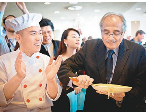
■聯合國副秘書長南威哲(右)在一名山西麵食技師的輔導下嘗試削麵技藝。

香港文匯報訊(記者 王寬應 山西報導)記者日前從山西省商務廳獲悉，本月5日，中國、山西美食走進聯合國，開幕式在紐約聯合國總部舉行，各國友人品味獨特特色的山西佳餚，感受中國美食文化的魅力。聯合國副秘書長南威哲在儀式上用中文表達了參加此次美食活動的喜悅之情。他說，中國的美食文化是中國文化的主要組成部分。據介紹，儀式揭幕標誌為山西傳統麵食花饅，這個高約60厘米的花饅由麵粉製成，數十層的花朵、果實等吉祥物裝飾色彩艷麗。作為山西人民食用、觀賞和禮儀所用的代表麵食，向在場觀眾展示了其長達幾千年傳承的悠久魅力。本次活動歷時4天。平遙牛肉、酸棗土豆擦、炒不爛子糕等以晉菜為代表的山西美食向聯合國的各國工作人員展示中國傳統飲食文化的風貌。