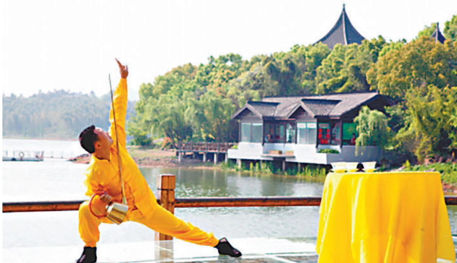
■天目湖會茶節從本月初在天目湖山水園推出以來，吸引了國內外眾多遊客。圖為會茶節上的長嘴壺表演。

香港文匯報訊(記者 周永峰 江蘇報導)江蘇溧陽地處長三角，擁有天目湖等國家著名生態旅遊景點。隨著南京至杭州高鐵的開通，溧陽旅遊業迎來新機。「高鐵時代促進了旅遊市場，也加速了遊客流動。」江蘇溧陽旅遊局局長湯全明在近日召開的第十三屆中國溧陽茶葉節暨第十屆天目湖旅遊節新聞發佈會上表示。高鐵時代，溧陽旅遊充滿了機遇和挑戰。