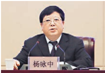
■甘肅省住建廳廳長楊詠中表示，將以六個統籌開展試點工作。

香港文匯報訊(記者 朱世強 蘭州報導)甘肅省住建廳廳長楊詠中昨日於新聞會表示，從今年起至2016年底的3年時間，甘肅省選擇15個縣(市)和30個鎮(鄉)開展新型城鎮化的試點，將在城鄉空間規劃、基礎設施建設、生產力佈局、社會公共服務、利用國土資源、城鄉環境保護等六方面開展統籌工作，取得成功經驗後再全面推廣。據了解，試點工作將統籌城鄉公共服務，加快農村社會事業發展，使農民在教育、醫療、住房、文化等方面逐步享受到與城鎮居民同等的待遇，逐步實現城鄉基本公共服務均等化。改革與戶籍掛鉤的福利制度，統籌解決住房保障、就業、子女就學、醫療衛生、社會保障等問題。同時推進城鄉要素平等交換，消除戶籍身份差別，建立城鄉統一的建設用地市場，實行城鄉產業聯動互補，賦予農民更多財產權利。