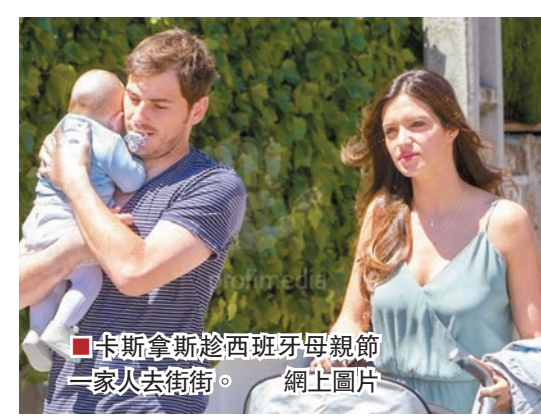
■卡斯拿斯趁西班牙母親節一家人去街街。

卡斯拿斯被西班牙《先鋒報》指涉及逃稅漏稅行為，鑑於「聖卡斯」只是誤解稅務條款，故補繳160萬歐元稅款後便不再被處罰。另日前馬德里體育會遭利雲特擊敗，後者小將魯賓加西亞賽後稱「為何不為勝出拿點小禮物」，即被指利雲特是收取「暗花」而搏盡，而外界認為受賄故意輸波才算有問題。