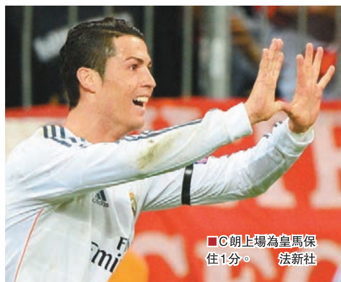
■C朗上場為皇馬保住1分。

日前西甲三強失分，今晚作客華拉度列若勝會奪冠，而排尾2的主隊科勒數難逃。(now 632台周四凌晨3:00a.m.直播)