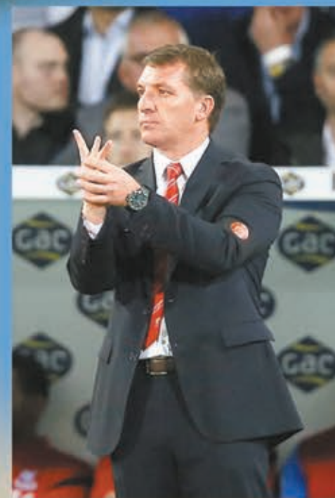
■連失3球，羅渣士也呆了。