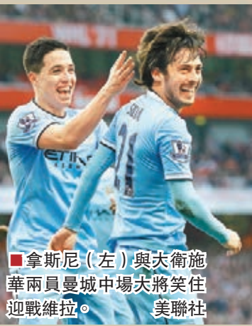
■拿斯尼(左)與次衛施華兩員曼城中場大將笑住迎戰維拉。 美聯社

另不懼強隊近4輪3勝1和的新特蘭於尾4多尾3諾域治2分，兼有少踢1場及13個得失球差優勢，今晚主場對尾5的西布朗各得1分，雙雙都夠成功護級(now622台周四凌晨2：45a.m.直播)。 ■香港文匯報記者 梁志達