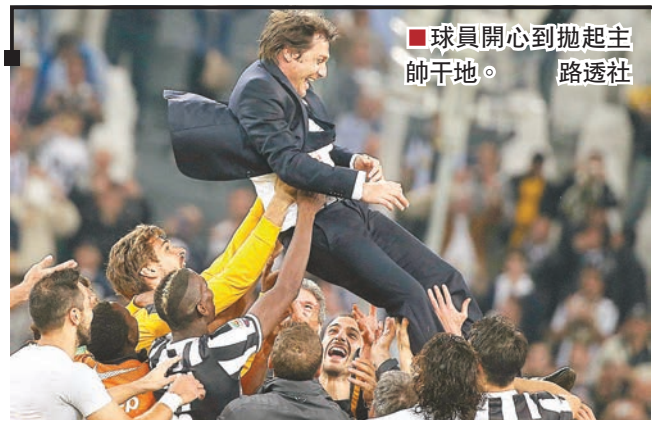
■球員開心到拋起主帥干地。

另最新有傳皇家馬德里為簽祖記法國新星普巴願付6,000萬歐元(約6.3億港元)轉會費，若成事他將成最高身價防中。 ■香港文匯報記者 梁志達