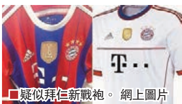
■疑似拜仁新戰袍。

網上流傳疑似德甲冠軍拜仁慕尼黑下季新波衫款式，其中藍白間被指似巴塞羅那，但早在1990年代拜仁已穿過類似戰衣。盛傳湯馬士梅拿與馬高列奧斯或分別離拜仁及多蒙特投曼聯，拜仁行政總監路明尼加直指梅拿「不舒服可坐低傾去留」，梅拿昨昨晚已表明無意離開拜仁。