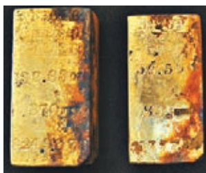
從「中美洲」號打撈的部金條。

「奧德賽探索」號上月航行至離岸257公里的海域勘查沉船，蛙人偵查期間發現5條重量介乎106至344盎司的金條，以及兩枚分別於1850及1857年由三藩市銀行鑄造、重量介乎96.5至313.5盎司，面值20美元的雙鷹金幣。據悉