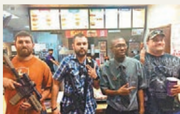
4名槍男嚇親人，還在合照。網上圖片

美國得州沃思堡市上周有多名持槍男子進入快餐店Jack in the Box，職員以為打劫，部分人倉皇走進雪房躲避。警方到場發現是虛驚一場，原來「槍手」在餐廳外和平示威，支持保留槍械合法化，晚上打算入快餐店用膳，身上長槍引起誤會。