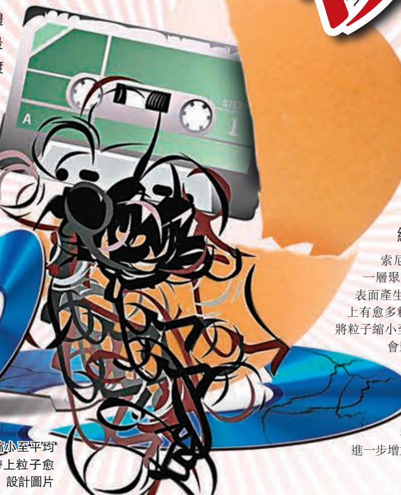
索尼將磁帶粒子縮小至平均只有7.7納米，磁帶上粒子愈多，儲存數據愈多。設計圖片

USB記憶棒、光碟、雲端服務等儲存檔案方便快捷，卡式錄音帶成為不少人的集體回憶。日本索尼最近透過修改「濺鍍沉積」過程，研發出新一代卡式帶，能儲存多達185TB數據，相當於傳統卡式帶容量的74倍，亦相當於3,700隻藍光碟，既懷舊又實用。