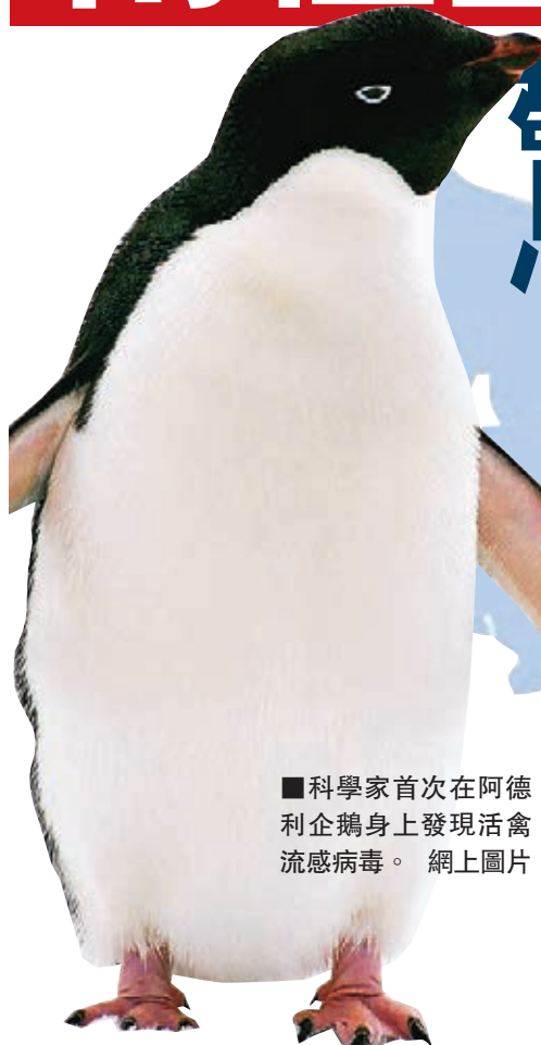
科學家首次在南極企鵝身上發現活禽流感病毒。