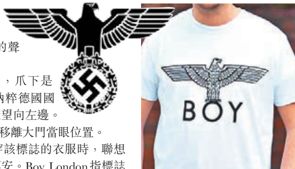
Boy London的標誌與納粹鷹(左圖)望向同一方向。

有波蘭籍男子稱，見到有人身穿該標誌的衣服時，聯想起二戰時波蘭被德軍入侵，感到不安。Boy London指標誌與納粹主義無關，解釋靈感來自羅馬帝國的鷹標記，包含力量及衰落的意思。歌手Rihanna、Jessie J等均曾穿過該品牌的衣服。