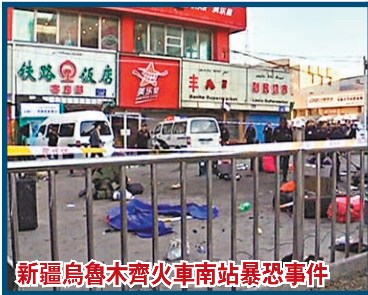
新疆烏魯木齊火車站暴恐事件

課題組專家指出，「10·28」之後，「突厥斯坦伊斯蘭黨」組織發言人阿卜杜拉·曼蘇爾宣稱，該組織將在中國更多地點發動襲擊活動，包括北京人民大會堂等。這種表態不應僅僅被視為虛張聲勢，而要認識到其實這就是恐怖組織的真實意圖。