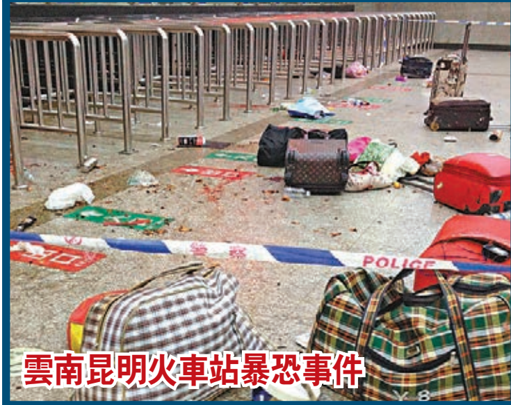
雲南昆明火車站暴恐事件