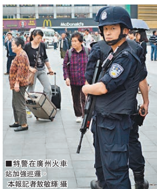
特警在廣州火車站加強巡邏。