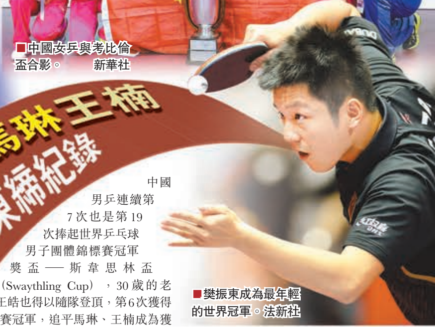
樊振東成為最年輕的世界冠軍。

中國男乒連續第7次也是第19次捧起世界乒乓球男子團體錦標賽冠軍獎盃——斯韋思林盃(Swaythling Cup)，30歲的老將王皓也得以隨隊登頂，第6次獲得團體賽冠軍，追平馬琳、王楠成為獲得團體世乒賽冠軍最多的運動員，同時還以18個世界冠軍追平馬琳。而年僅17歲的樊振東則同時打破「師兄」馬龍的紀錄，成為男乒歷史上最年輕的世界冠軍。