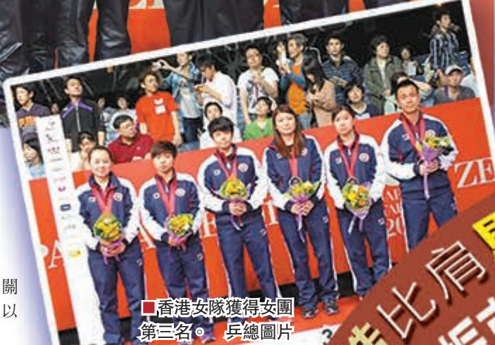
香港女隊獲得安國第三名。