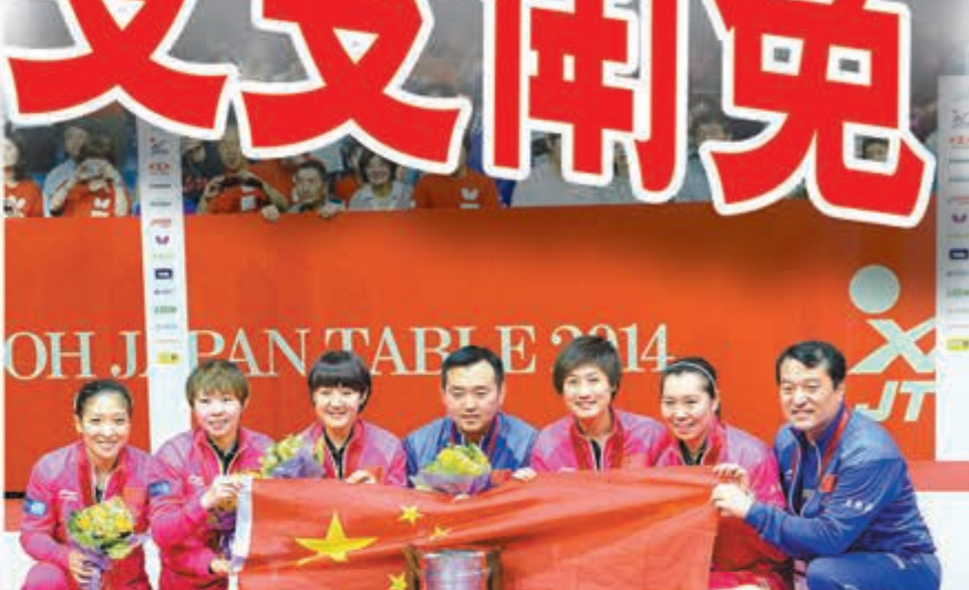
中國女乒與考比倫盃合影。