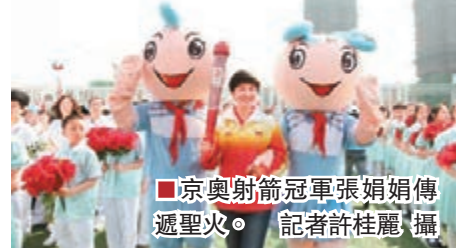
京奧射箭冠軍張娟娟傳遞聖火。

香港文匯報訊(記者許桂麗、張勇 實習記者 陳艷 于騰飛 李婷婷 青島報導)北京奧運會女子個人射箭冠軍張娟娟日前走進青島文登路小學，與熱情的師生共同開展了一場別開生面的「小小奧運會」。據悉，此次運動會最大的亮點是以模擬「奧運會」的形式開展。23個班級分別代表23個國家，展示各具異國情懷的體育特色及精神。笑聲、加油聲洋溢著奧運精神迴盪校園，拉近了師生、親子的距離。