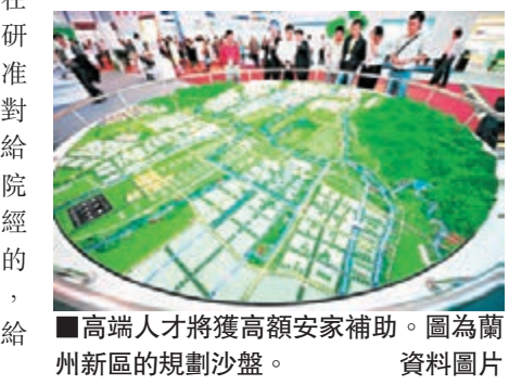
高端人才將獲高額安家補助。圖為蘭州新區的規劃沙盤。

該政策規定,與用人單位簽訂5年以下勞動(聘用)合同的高層次人才,可享受200平方米的專家公寓。在蘭州新區設立的國家級工程技術研究中心和重點實驗室,經審核批准後,一次性給予500萬元獎勵;對新建的院士專家工作站,一次性給予100萬元資金支持,並按進站院士人數人均每年給予5萬元工作經費。同時,對由高層次人才主持的蘭州新區重點產業科技創新項目,經蘭州新區管委會審核確認,可給予300萬元科研啟動經費。