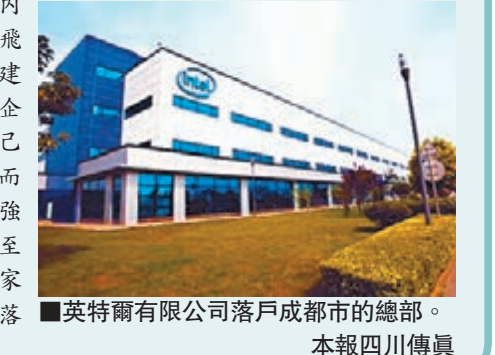
英特爾有限公司落戶成都市的總部。

近年在「外資西進,內資西移」的大背景下,飛利浦、索迪斯、中國建築、博世等世界500強企業,紛紛在成都設立自己的西區或西南區總部,而且落戶成都的世界500強企業數量屢屢刷新,截至2013年年底,已有252家世界500強選擇在成都落戶。