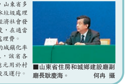
山東省住房和城鄉建設廳副廳長耿慶海。

據了解,山東省當前的城鎮化率為53.75%,2010年以來,該省各級財政累計投入114.3億元用於村鎮污水垃圾處理設施建設及運行。