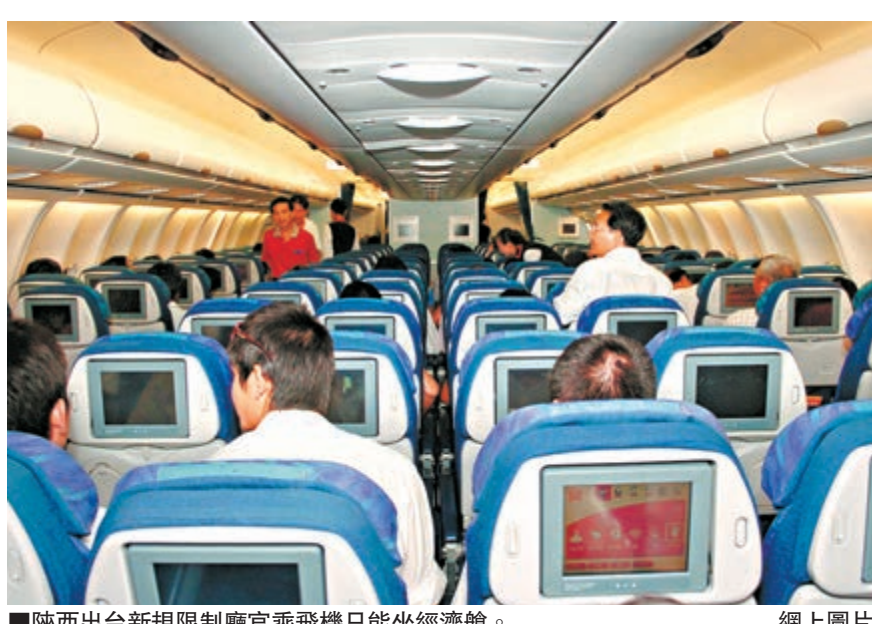
陝西出新高規限制廳官乘飛機只能坐經濟艙。網上圖片

香港文匯報訊(記者 張仕珍 西安報導)陝西省本月1日起開始施行新的《省級機關差旅費管理辦法》,對公務出差所發生的城市間交通費、住宿費、伙食補助費和市内交通費做了新規定。根據《辦法》,省級以下領導,即便是廳局級幹部,出行乘飛機也只能乘坐經濟艙。若未按規定等級乘坐交通工具,超支部分將由個人自理。