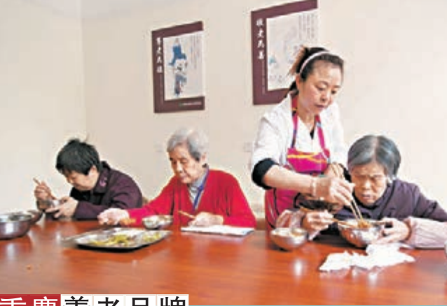
重慶養老品牌 重慶打造社區養老標準化品牌「老吾老」,為區域內老人提供高效規範的養老服務。「老吾老」項目由區民政局統一向各社區提供,鎮街具體承接項目的立項、施工、設備採購。圖為位於大渡口區春暉街道的「老吾老」老年人活動中心。

福建 香港文匯報訊(記者 蘇榕蓉 福州報導)福建省近日正式批覆南平邵武市成為第五個省級新型城鎮化試點城市。福建省發改委有關負責人表示,邵武市新型城鎮化試點將重點推動規劃建設、人口管理、土地管理、環境保護、公共服務、體制機制等關鍵領域改革。根據相關方案,邵武將構建要素匹配、功能齊備、服務完善的「產業—城市」空間複合體。