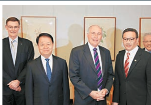
交通運輸部部長楊傳堂(右三)參加中澳馬三方部長級會議後的記者會。

中方續出人力物力財力 中國交通運輸部部長楊傳堂率代表團出席會議。他在結束後的記者會上說，目前搜尋馬航將進入一個新階段，從大規模的水面、空中搜尋轉到水下搜尋，中方將繼續積極主動地參與搜尋，在人力、物力和財力上作出貢獻。中國接下來將主要做好四方面工作。第一，認真落實過渡階段搜索方案，中國政府將派3艘船隻參與搜尋；第二，中國將積極支持