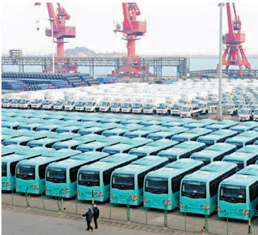
今年一季度，中國服務出口530億美元，同比增長14%。圖為一批國產車輛在江蘇連雲港港口等待出口海外。

根據世界貿易組織統計數據，2013年，中國已經超越美國成為世界貨物貿易第一大國。然而，貿易大國並不等於貿易強國，學者普遍認為，中國要想成為貿易強國提升服務貿易的國際競爭力至關重要。 目前，服務外包、文化貿易是服務貿易的重要組成部分。周柳軍表示，今年商務部將出台新一輪服務外包促進政策，啟動《中國國際服務外包產業發展規劃2016-2020》的前期工作，加快國際營銷網絡建設，利用出口信貸促進服務外包產業發展，盡快推動出台所得稅政策，研究制定中高端人才及企業內訓的支持政策。 在文化貿易方面，周柳軍說，商務部今年將加快實施文化「走出去」工程，抓緊建立對外文化貿易工作聯繫機制，完善對外文化貿易財政支持政策，開拓對外文化貿易工作新領域。