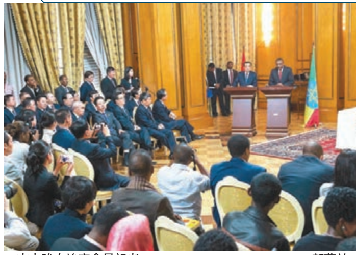
■李克強在埃塞會見記者。