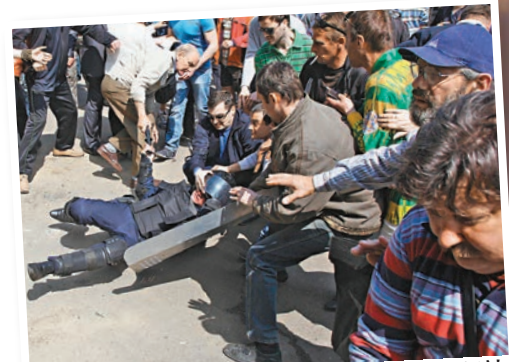
■民眾與防暴警察衝突。