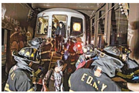
■消防員協助乘客離開車廂。

美國紐約地鐵前日發生列車出軌事故，最少19人受傷，其中4人傷勢嚴重需送院治療，逾千名乘客緊急疏散。事件導致多條地鐵路線服務一度受阻，該晚下班人