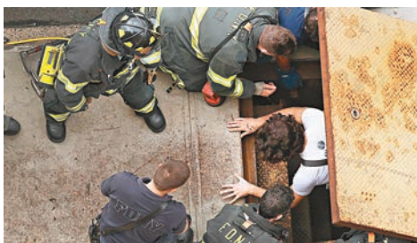
■乘客從緊急出口爬出地面。

流高峰前，部分路線已恢復正常服務。事發於前日上午約10時半，一列有8個車廂、開往曼哈頓方向的列車，在駛至距離皇后區65街地鐵站約360米時，除車頭和車尾外6個車廂突然出軌。數十名消防員、警員和救護員隨即趕至現場，用梯子協助車上乘客疏散，並截斷另一條鄰近路線的電源。