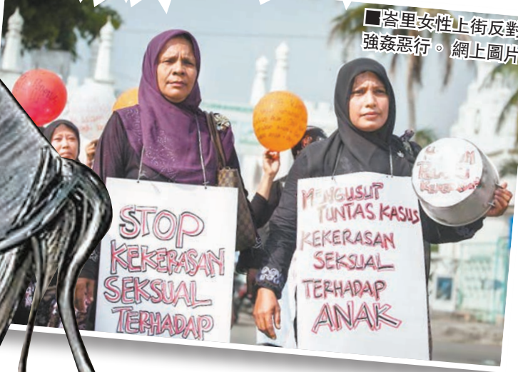
峇里女性止街反對強姦惡行。

印尼峇里島一名19歲青年多次強姦一名14歲女孩，並令對方因姦成孕。被告為換取輕判，表示願意跟受害人結婚及照顧將出生的孩子。這項厚顏無恥的求情理由竟獲法官接納，更形容是「友善舉動」，輕判被告入獄18個月。事件觸發當地保護婦孺組織不滿，狠批法官未有負起保護兒童的責任。