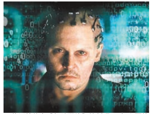
尊尼特普在《超越潛能》的劇照。

諾貝爾物理學獎得主霍金日前在英國《獨立報》撰文，呼籲公眾關注人工智能(AI)發展可能帶來災難。他以尊尼特普最新電影《超越潛能》為例，指人工智能可能是「人類史上最後一宗大事件」，專家應及早準備及研究方案，防止人工智能進化失控危及人類。