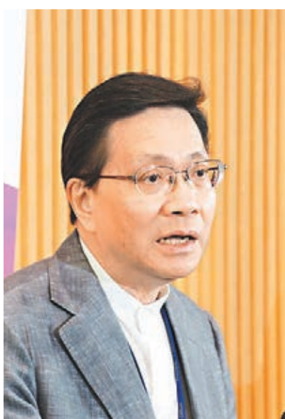
張炳良否認與港鐵合謀隱瞞，他表示去年11月，政府已質疑高鐵路未必能於2015年通車，但港鐵認為可追回進度，政府決定「疑中留情」，說出包容雙方立場的版本。

香港文匯報訊(記者 陳廣盛)廣深港高鐵香港段工程延誤風波鬧得愈來愈大，港鐵日前更在向立法會提交的報告中，指政府早於去年已知高鐵路工程出現阻滯。多名官員昨日就指控作出澄清，政務司司長林鄭月娥表明不認為有官員與港鐵合謀或蓄意隱瞞；運輸及房屋局局長張炳良更召開記者會，否認與港鐵合謀隱瞞高鐵路工程延誤，他表示去年11月，局方與港鐵已存在明顯分歧，局方當時已經認為高鐵路未必能於2015年通車，但港鐵認為可以，最後局方決定「疑中留情」，於是在立法會上說出包容雙方立場的版本。