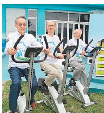
黃錦星(中)表示，社會希望有一個建設性的進度去解決問題。

性的結果去解決問題。對於會否考慮將焚化爐及堆填區議題分開在立法會討論，他認為，社會希望政府作全盤考慮及討論。黃錦星又說，這兩項不是全新議題，在區議會及社會上已有足夠討論，如果再拖延，擔心工程造價會有上漲的壓力。