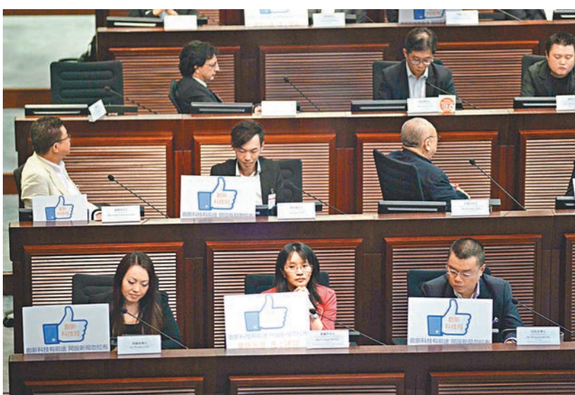
立法會資訊科技會議。出席會議的資訊科技界代表在席上展示「Like」的字牌，支持盡快成立創科局。

「公共專業聯盟」議員莫乃光則稱，反對派對特區政府的建議有憂慮是可以理解的，但不應該因為「不信任特區政府」，