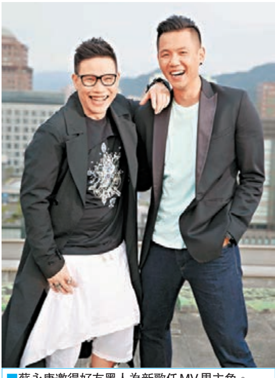
蘇永康邀得好友黑人為新歌任MV男主角。

「加碼」，所以一整天拍下來，黑人和女主角有多場的親密畫面，雙方又是擁、又是抱，耳鬢廝磨、難分難捨！康仔知非同小可，特別隔空向范范喊話：「姊妹，求你看在師兄的份上，放過你老公！」還捕一句：「是我的責任！」相當有擔當。