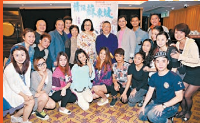
演出順利完成，台前幕後開心慶功。