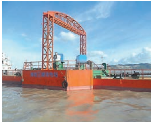
■世界最大發電容量立軸潮流能電站。

據悉,「海能III」號採用哈爾濱工程大學研發的總容量為2*300kW的雙機組十字交叉水輪機專利技術和漂浮式雙體船載體設計,全部自主設計開發。潮流能裝置能夠實現自啟動運行,發出的電力通過500米長的海底電纜送電上岸,可供官山島上30餘戶人家的日常用電。該電站的成功運行,為我國潮流能發電系統的總體設計、核心部件配套、機組安全運行及其優化控制等方面積累了經驗,同時也標誌着我國潮流能發電技術向產業化開發再邁堅實一步。