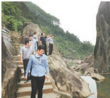
■遊客在青嵐省級地質公園。

記者深入饒平採訪,饒平依山面海,自然條件優越,勝景奇觀繁多,古有「嶺南佳勝地,瀛海古蓬萊」之譽。擁有國家4A級旅遊景區綠島山莊、青嵐省級地質公園、「海龍」世界地質遺產奇觀、中國休閒垂釣基地柘林灣、千年古刹海山隆福寺、趙樸初題書「粵東一壁」的石壁山風景區、國家重點文物保護單位三鏡道韻樓。