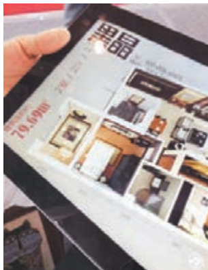
■「增強現實」將平面圖紙呈像為3D效果。

香港文匯報訊(記者許桂麗,實習記者全沛瑾、劉念 山東報道)2014第十四屆中國(青島)國際時裝周暨青島名牌產品展示周、第三屆青島市中小企業「專精特新」成果展日前在青島國際會展中心開幕。最新前沿、高端科技創新產品為代表的161家中小企業的500餘產品(技術)將帶來前沿科技創新體驗,標誌着中小企業向藍色、高端、新興領域方向發展的趨勢。