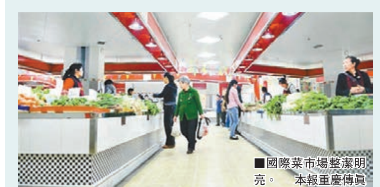
■國際菜市場整潔明亮。

香港文匯報訊(實習記者張馨月 重慶報道)4月29日,重慶渝中區打造的首個國標菜市場正式開門營業,前來買菜的居民高興地說,周邊8萬多居民買菜更方便了。