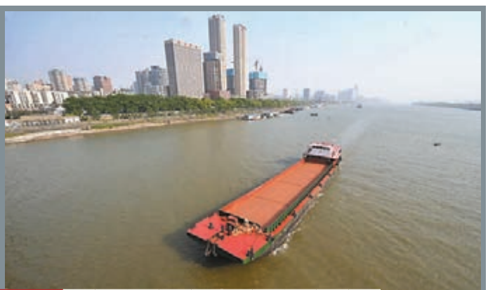
湖南湘江航運迎「黃金」季 近日,長沙湘江受降雨影響水位持續上漲,江面上水運繁忙,有望提前進入航運「黃金」季。長沙水文站監測數據顯示,截至5月2日8時,長沙湘江水位上漲至28.26米。圖為5月2日,一艘貨船在長沙湘江主航道行駛。

香港文匯報訊(記者李欣 天津報道)「愛新覺羅書畫藝術館」上月27日在津揭牌,並免費對遊客開放。該館館藏涉及愛新覺羅家族「溥、毓、恆、啟」四輩人的書法、山水、花鳥、鞍馬、人物等書畫作品,共計102幅。藝術館位於津南區小站練兵團東側,佔地約300平方米,共設有9間展室,由連廊相接,營造出清代宮廷意蘊,同徽派風格的小站練兵團相互映襯。