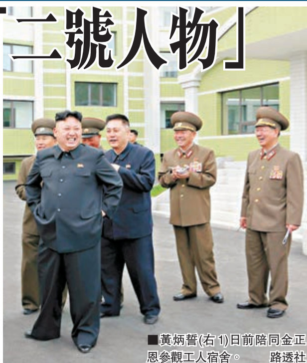
■黃炳誓(右1)日前陪同金正恩參觀工人宿舍。