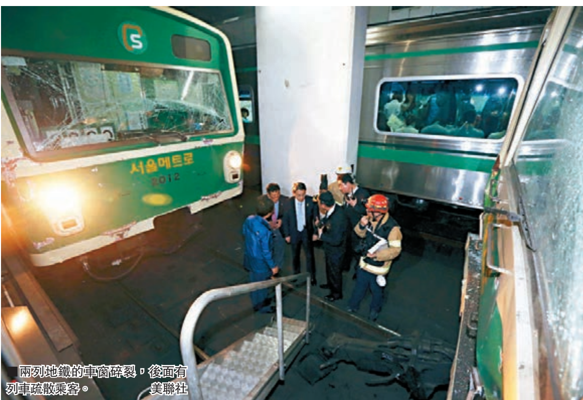
兩列地鐵的車廂碎裂，後面有列車疏散乘客。