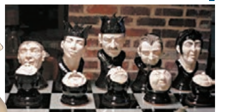
黑棋國王(左3)與皇后(左2)表情鬼。網上圖片

國王，約12吋，黑棋國王是一位奸形惡相的朋友，白棋國王則是個性隨和的朋友。 ■《每日郵報》