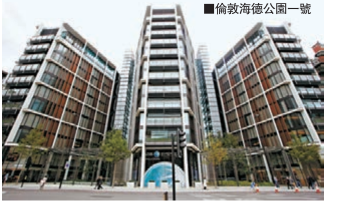
倫敦海德公園一號

英國倫敦西部一個頂樓複式豪宅單位，日前以1.4億英鎊(約18.3億港元)售出，創下倫敦樓市最高呎價紀錄，買家相信是來自俄羅斯的富豪，但未獲證實。有開發商警告，英國樓市部分叫價將難以維持。