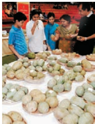
印度是芒果主要產地。資料圖片

歐盟於5月1日開始禁止從印度進口芒果等蔬果，持續至明年底。禁令不會對印度經濟構成太大影響，但印度與歐盟經貿關係密切，分析指事件會令雙方貿易爭議升溫，若不及早解決，可能影響歐印自由貿易協議談判。