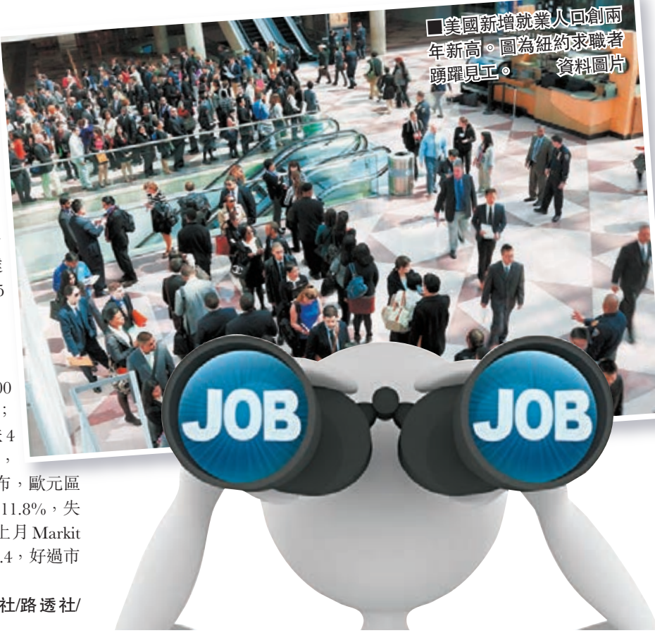
美國新增就業人回創兩年新高。圖為紐約求職者踴躍見工。資料圖片