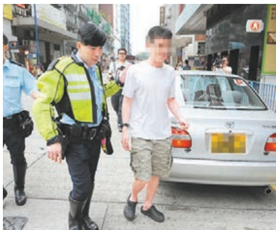
觀塘開源道車內嘔吐「P牌」仔涉醉駕被捕。

警員到場時,身有酒氣的私家車司機已改坐在乘客位,警員在日擊者提供資料下,要求司機接受酒精呼氣測試。現場消息稱,私家車司機在警員再三催促時,疑自知難以脫罪,竟說「唔駛催,我知我會過喇!」結果「一吹」之下顯示其體內酒精含量達40多微克,超過法例規定,警員遂以涉嫌「酒後駕駛」將涉案司機拘捕。