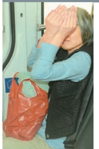
遭老父喊斬女兒躲在房內報警,最終獲救。