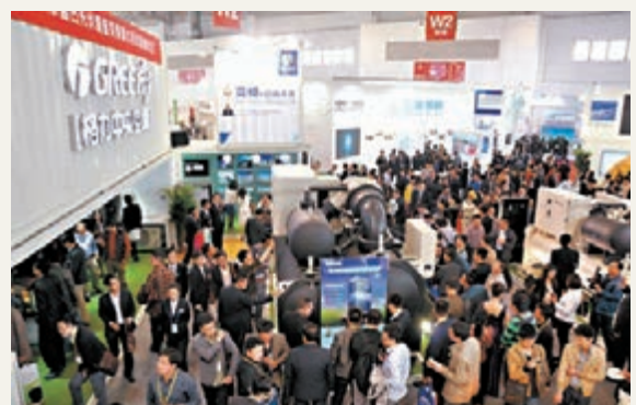
■格力光伏變頻離心機備受客商關注。 本報珠海傳真

專家表示,格力在離心機技術上的成就,不僅強化了格力在世界舞台上的競爭力,也進一步彰顯了我們的技術創新實力,標誌著我國空調行業的技術水平正在高速超越歐美,讓中國真正有了俯視全球的自主產業。