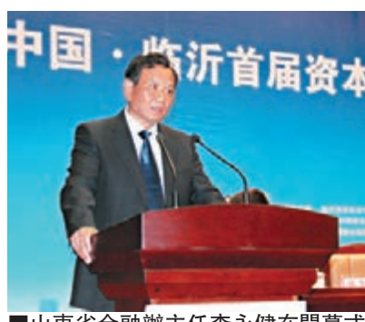
■山東省金融辦主任李永健在開幕式上致辭。

香港文匯報訊(記者 孫吉成、通訊員 張燕 臨沂報導)4月28日至29日,中國·臨沂首屆資本交易大會暨全國地方金融第十八次論壇在臨沂國際會展中心隆重舉行。資本交易大會共簽約招商項目89個,合同金額1,305.37億元(人民幣,下同)。其中金融招商合同項目25個,合同金額868億元,當年可實現611億元;產業招商合同項目64個,合同金額437.37億元。