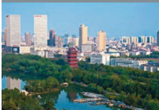
■合肥包河區遠眺。 本報安徽傳真

香港文匯報訊(記者 張長城 合肥報導)合肥市包河區是安徽「第一城區」,經濟和社會發展一直引領安徽各地。今年第一季度,包河區實現招商引資111.6億元(人民幣,下同),增長34.2%,位居合肥市第一位。包河區委書記胡啟生表示,將持續深化改革,打造合肥改革先行先試的示範區,建設全國一流的省會城市標誌區。