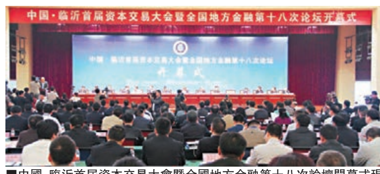
■中國·臨沂首屆資本交易大會暨全國地方金融第十八次論壇開幕式現場。

中國·臨沂首屆資本交易大會由山東省金融工作辦公室、臨沂市人民政府主辦,以推進產融結合為宗旨,突出「創新、合作、實效」等特點。大會旨在充分展示臨沂市經濟社會發展的亮點,加強交流合作,拓寬融資渠道,加快臨沂商城國際化進程,推動區域金融中心建設。