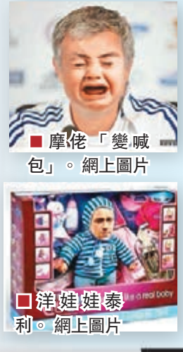
摩帥「變喊包」。

摩BB泰娃變喊包 車路士悲情人物摩連奴和泰利成電腦世界被改圖的對象，「寸王」被改成BB喪喊開記招，「鐵血隊長」則變成新出的「淚流洋娃娃」。另有網民將泰利「弄到」更衣室慶祝的馬體球員當中。 藍軍傳吼保連奴 查漢奴古 英報傳出，藍軍有意將外借歸隊的前鋒盧卡古加錢羅致熱刺巴西中場國腳荷西保連奴，另睇中獲譽新奧斯爾的漢堡中場查漢奴古。