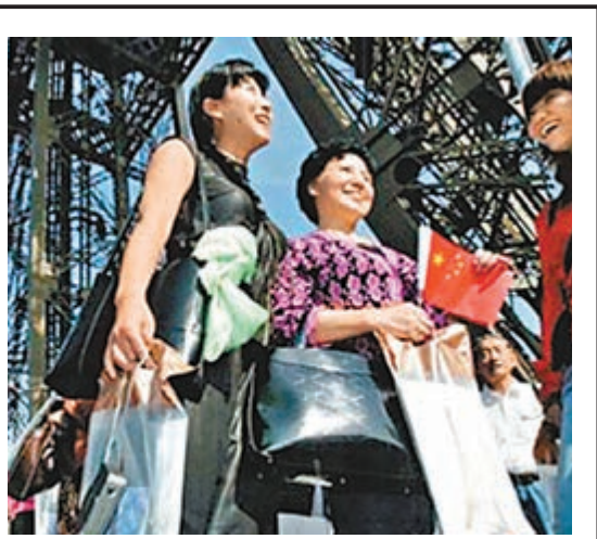
為了確保中國旅客與當地警方的溝通，逾十名中國警察將赴法國擔任溝通工作。