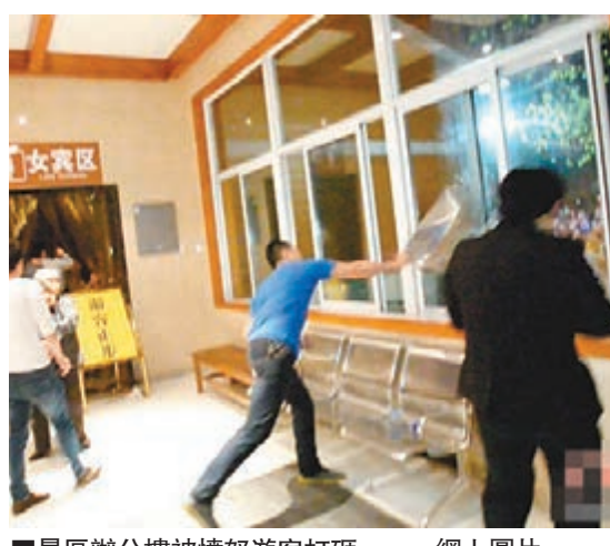
景區辦公樓被憤怒遊客打砸。

據中新網報道，「湘湖金沙戲水螢飛夜主題活動」開幕前早已做好了廣告宣傳。主辦方以「浪漫」之名，承諾現場放飛近3萬隻螢火蟲，遊客可觀賞到「飛流螢」般美輪美奐的視覺效果。這使得活動短時間內人氣劇增，官方定價30元/人的門票轉手被「黃牛黨」炒到了180元/人。