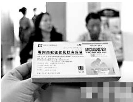
出現問題疫苗的藥盒。

香港文匯報訊 西安24名小學生前日在丈八社區衛生服務中心接種白破疫苗，卻發現6支疫苗中有2支已過期5天，事件涉及8名兒童。