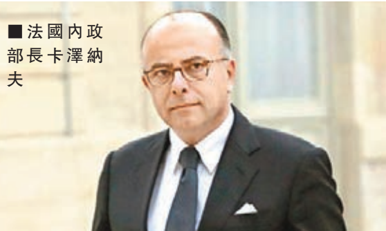
法國內政部長卡澤納夫

另外，現任總理曼努埃爾·瓦爾斯在接任內政部長時就已經確定在今年6月到中國訪問，新任法國內政部長表示期待這次訪華行程與中國在反恐、安全等方面進行更加緊密的合作。