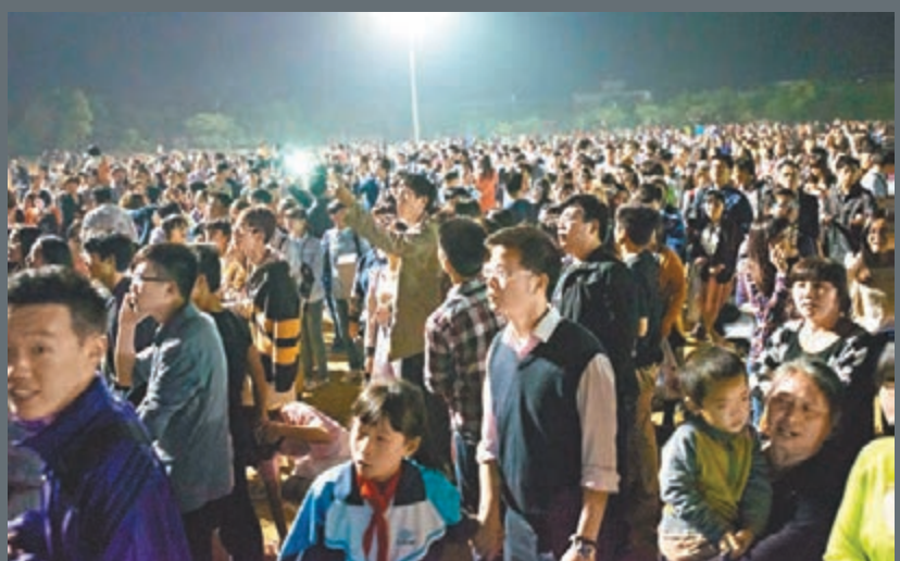
前日，浙江杭州蕭山湘湖金沙戲水螢飛夜主題活動，近萬名遊客聚集在景區辦公樓前起哄退票。

香港文匯報訊 浙江杭州蕭山湘湖前晚舉辦一場以放飛螢火蟲為主題的活動，由於現場螢火蟲太少，未達視覺效果，導致遊客與主辦方發生衝突，有遊客搗毀辦公設施，演變成萬人齊喊退票的混亂場面。警方現已介入該事件。